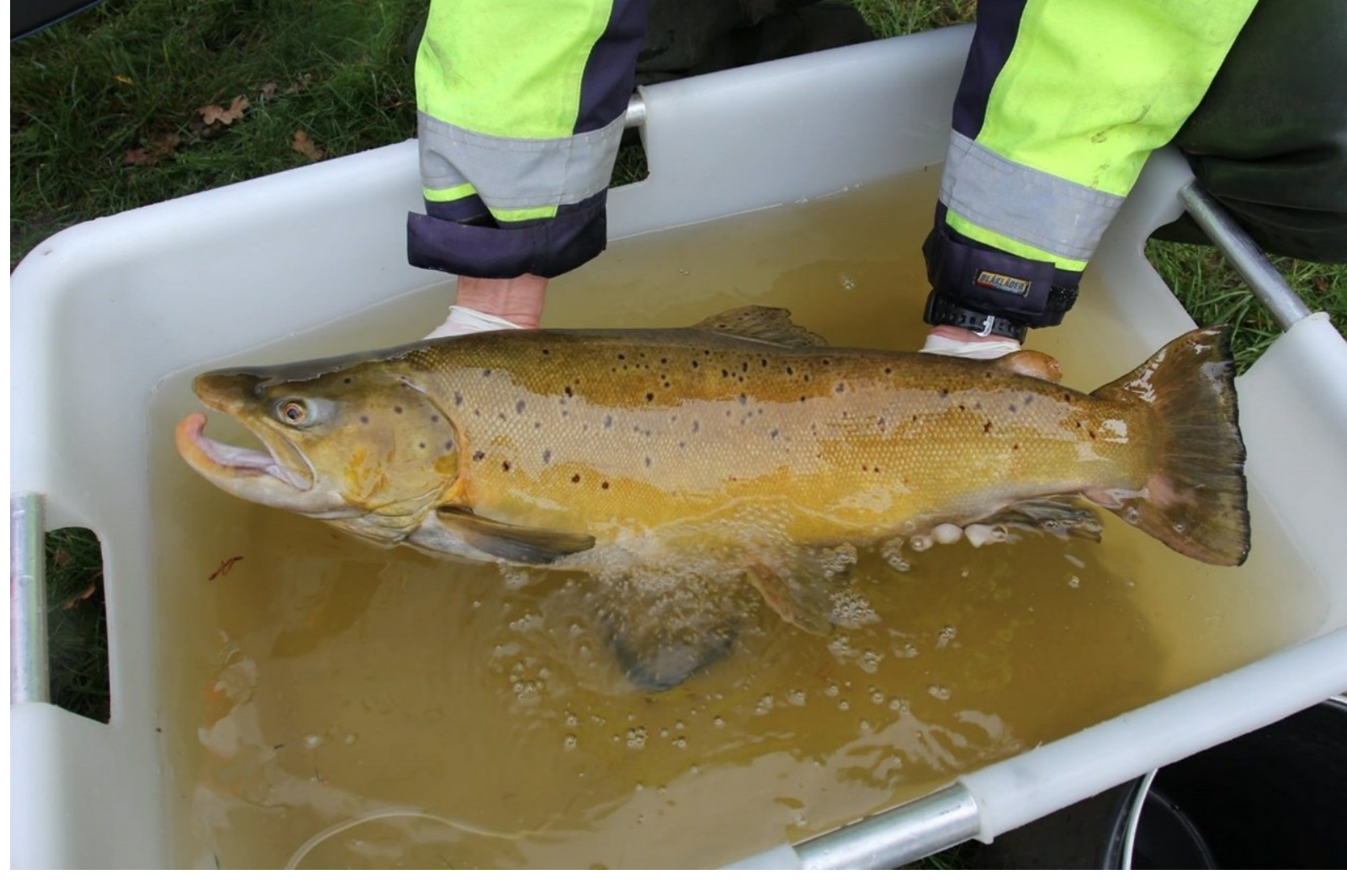
Een zeeforel van 77 cm en 6,2 kg. Deze bijzondere vangst werd in oktober 2020 gedaan bij stuw Vechterweerd tijdens het vierjarig migratieonderzoek Swimway Vecht waarbij zo'n 25 vrijwilligers van Sportvisserij Oost-Nederland actief betrokken zijn.