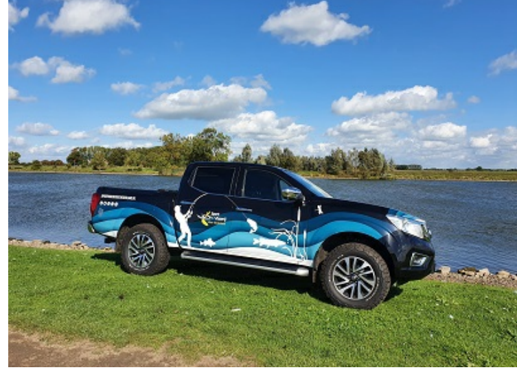
De terreinwagen wordt veelvuldig ingezet, o.a. bij controleacties.

In het artikel op onze website lees je de resultaten.