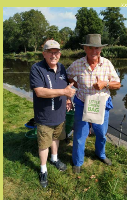
Controleur deelt de milieuvriendelijke 'little green bag' uit.

Sportvisserij Oost-Nederland bekijkt of deze actie in 2023 wordt vervolgd. Vis je al loodvrij? Laat dit vooral weten op jouw sociale media en gebruik #IKVISLOODVRIJ.