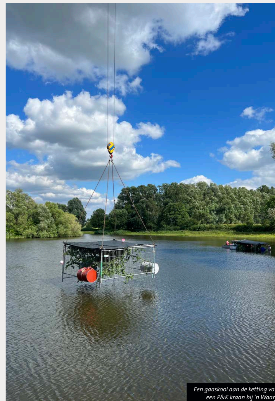
Een gaaskooi aan de ketting van een P&K kraan bij 'n Waarf.

Hengelsportvereniging 't Zumpke uit Enter voert samen met Sportvisserij Oost-Nederland een pilot uit op De Lee. Sinds een aantal maanden staan in de ondiepe plas twee gaaskooien op de bodem. Hiermee hopen we de vispopulatie – met name in de winter – bescherming te bieden tegen aalscholvers.