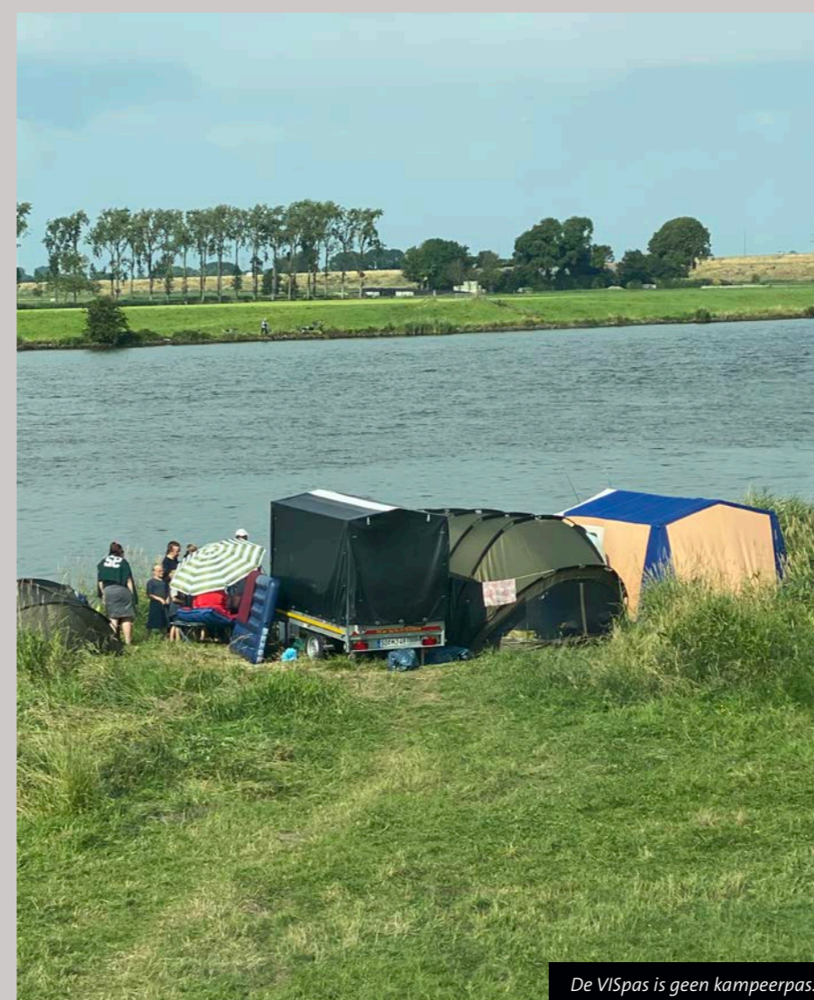
De VISpas is geen kampeerpas.

Ondanks een geldige VISpas levert bijna een op de vier nachtelijke controles een situatie op waarin wordt bekeurd. Dat aantal is natuurlijk veel te hoog. Daarnaast heeft Project Nachtuil ook behoorlijk wat media-aandacht gekregen en zijn vanuit verenigingen handhavingverzoeken gekomen. Sportvisserij Oost-Nederland heeft veel positieve reacties ontvangen en dit project krijgt dan ook zeker een (noodzakelijk) vervolg. Er wordt momenteel gekeken of volgend jaar op deze voet verder wordt gegaan of dat er een interventieteam wordt opgericht om de 'hitteplekken' meer structureel te controleren.