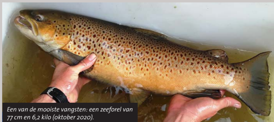
Een van de mooiste vangsten: een zeeforel van 77 cm en 6,2 kilo (oktober 2020).

Na 4 jaar vismigratieonderzoek op de Overijsselse Vecht zijn de resultaten van het project Swimway Vecht bekend. Vele tientallen vissen zijn gezenderd en gevolgd in een riviersysteem met een lengte van meer dan 200 kilometer. Dankzij dit onderzoek zijn de belangrijkste migratieknelpunten voor trekvis in kaart gebracht. Met de opgedane kennis kan het beheer en de inrichting van de Vecht worden verbeterd om deze ecologisch te versterken en de visstand te verbeteren.