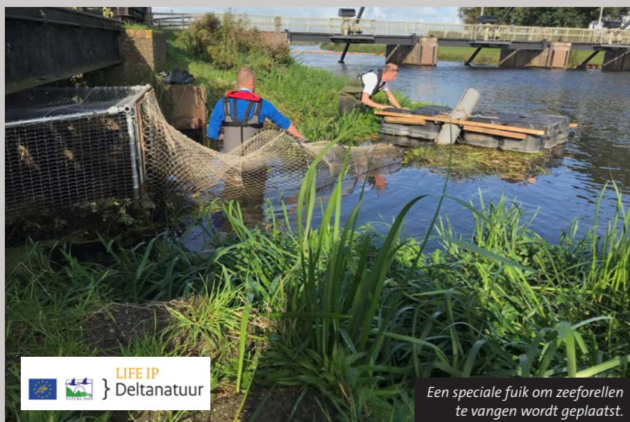
Een speciale fuik om zeeforellen te vangen wordt geplaatst.

De komende jaren worden er op de Vecht verschillende vistrappen en meestromende nevengeulen aangepast en gerealiseerd. De vismigratierivier bij de Afsluitdijk leidt er ongetwijfeld toe dat de uittrek van paling, zeeforel en houting groter wordt. Dit biedt kansen voor het hele ecosysteem. Meer constant stromend water met ruimte voor de rivier is erg belangrijk, zodat we zorgen voor de juiste (vis)leefgebieden. De onderzoekers pleiten voor een gecoördineerde aanpak en voor blijvende samenwerking. Uit het onderzoek volgen verder aanbevelingen om meestromende nevengeulen rondom elke stuw te realiseren en om diverse vispassages te vernieuwen en beter te beheren.