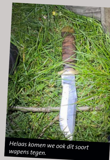
Helaas komen we ook dit soort wapens tegen.

De jarenlange controles blijken hun vruchten af te werpen. Tegenwoordig zijn de paieren van de meeste sportvisserijers in orde. Het gaat echter vaak mis bij de voorwaarden van de VISpas en NachtVIStoestemming. Dit kan soms ook best lastig zijn omdat op verschillende plekken verschillende voorwaarden gelden. De meeste vissers lopen tegen een proces-verbaal aan omdat ze de