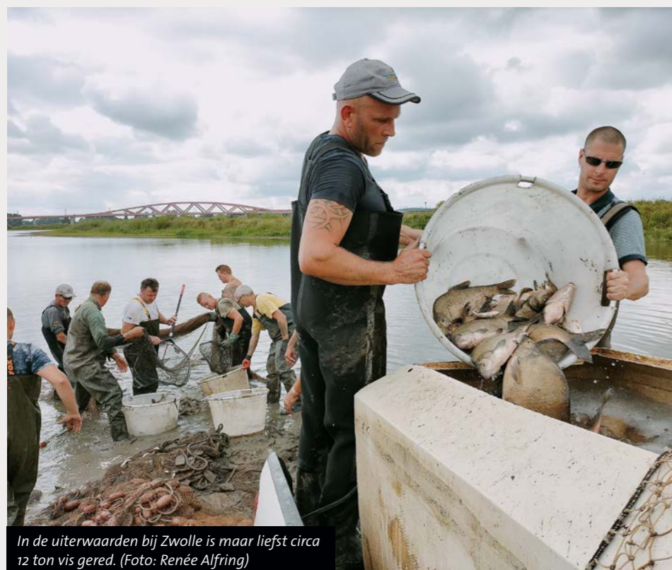
In de uiterwaarden bij Zwolle is maar liefst circa 12 ton vis gered.

Sportvisserij Oost-Nederland wil nogmaals alle vrijwilligers bedanken die zich het afgelopen jaar geheel belangeloos hebben ingezet om vissen in nood te redden. Zonder jullie waren al deze reddingsacties niet mogelijk geweest.