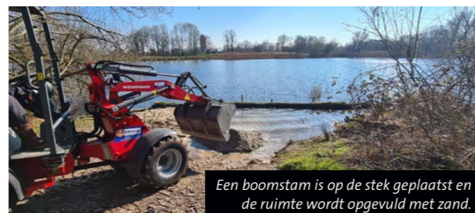
Een boomstam is op de stek geplaatst en de ruimte wordt opgevuld met zand.

Bovendien krijgen visstekken een upgrade. Sportvisserij Oost-Nederland heeft met lokale vissers in 2021 een visstek als test opgeknapt. Deze werd direct favoriet en is veelvuldig gebruikt – in 2022 zijn nog drie visstekken bij de Stobbeplas aangepakt.