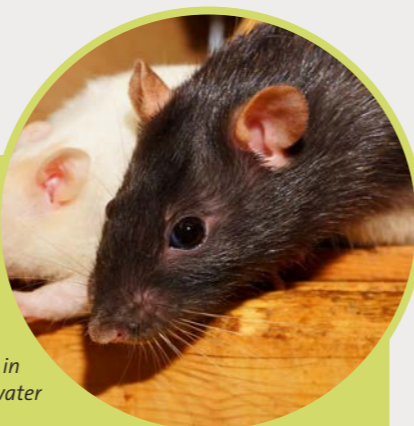
De Ziekte van Weil wordt overgebracht door rattenurine in oppervlaktewater