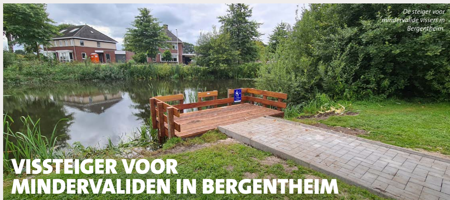
De steiger voor mindervalide vissers in Bergentheim.