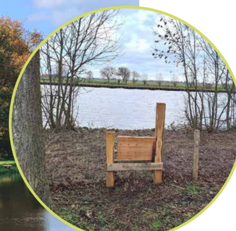
Overstapje aan het Meppelerdiep.