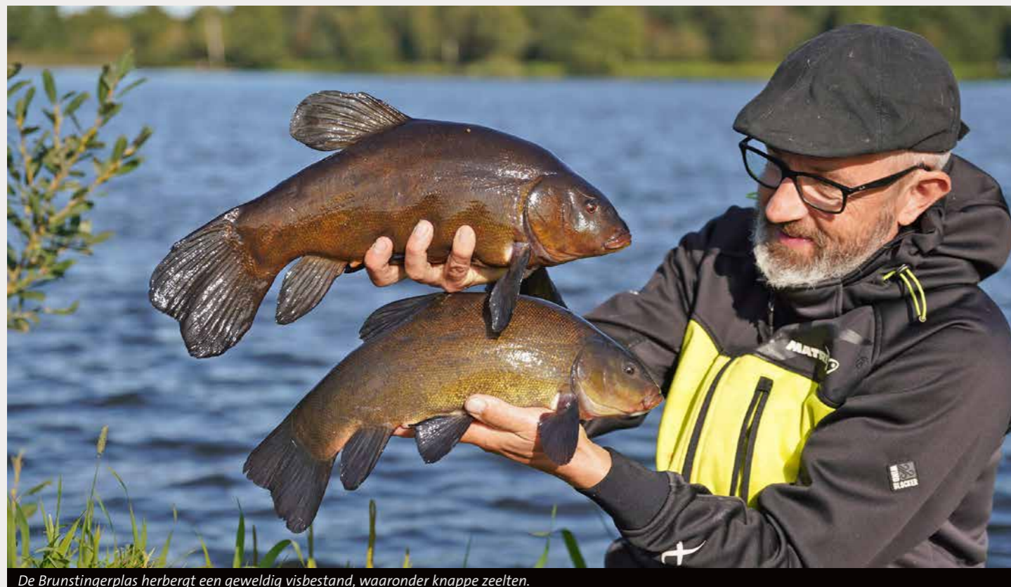
De Brunstingerplas herbergt een geweldig visbestand, waaronder knappe zeelten.

V lak over de grens met Overijssel, langs de snelweg A28, ligt Rogat aan de Hoogeveen- se Vaart. Het gemaal van de Rogatsluis is populair bij witvissers die hier voornamelijk de feederhengel inzetten. In de kom onder het gemaal verzamelt zich tijdens de paai- trek veel vis zoals grote windes en brasem. Ook is het een gekende stek voor roofvis en karper. Het kanaal aan de westkant van het gemaal is eenvoudig bereikbaar met de auto via de Veltkampweg.