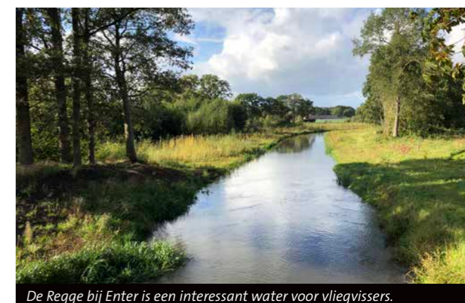
De Regge bij Enter is een interessant water voor vliegvisser.

Her en der in ons gebied liggen mooie vissteigers waarvan er een aantal goed toegankelijk en veilig voor mindervalide sportvissers zijn. Zij kunnen ook een vistrip boeken op de Overijsselse Vecht met onze Vechtschippers op een aangepaste rolstoelvriendelijke elektroboot. Op www.sportvisserijoostnederland.nl vind je meer informatie over de sportvismogelijkheden.