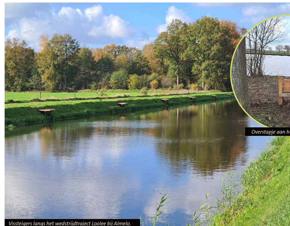
Vissteigers langs het wedstrijdtraject Loolee bij Almelo.

Om je enigszins wegwijs te maken in alle mogelijkheden, voorzieningen en regels binnen de sportvisserij, ontvang je bij deze regio-editie van Hét VISblad een handige snelstartgids met daarin belangrijke basisinformatie. Waar nodig staan websites vermeld om zaken meer gedetailleerd op te zoeken. Heb jij de snelstartgids zelf niet nodig? Geef hem dan aan een andere (beginnende) sportvisser.