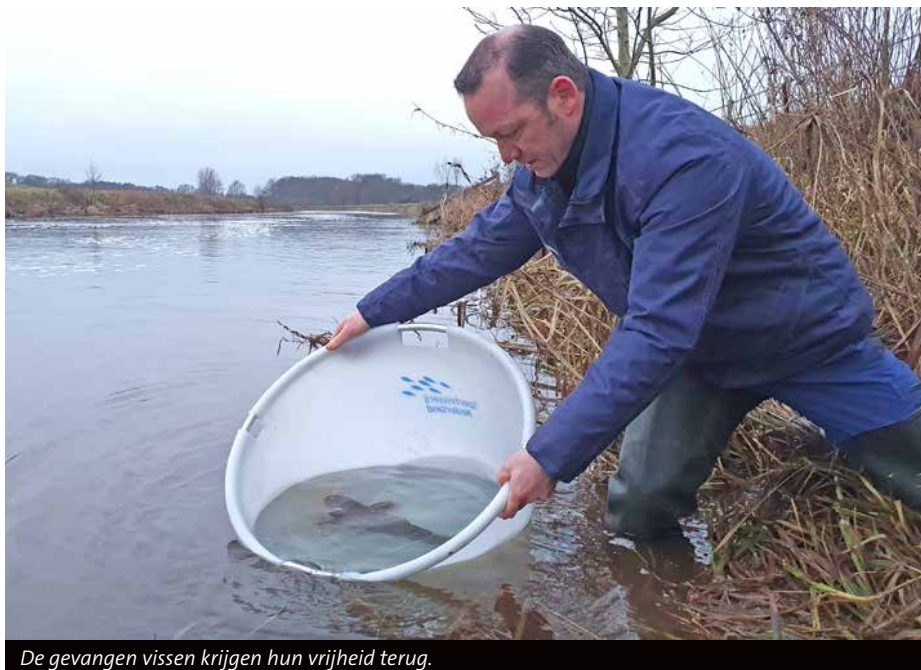
De gevangen vissen krijgen hun vrijheid terug.

Sportvisserij Oost-Nederland werkt sinds 2008 samen met Sportvisserij Nederland en twaalf andere partners aan de uitvoering van een grootschalig en uniek visonderzoek op de Vecht. In elke regio-editie van Hét VISblad besteden we daar aandacht aan en soms lichten we een van doelsoorten van het onderzoek uit. Na de paling, winde en zeeforel vertellen we je in dit artikel meer over de kwabaal en het onderzoek naar deze vis.