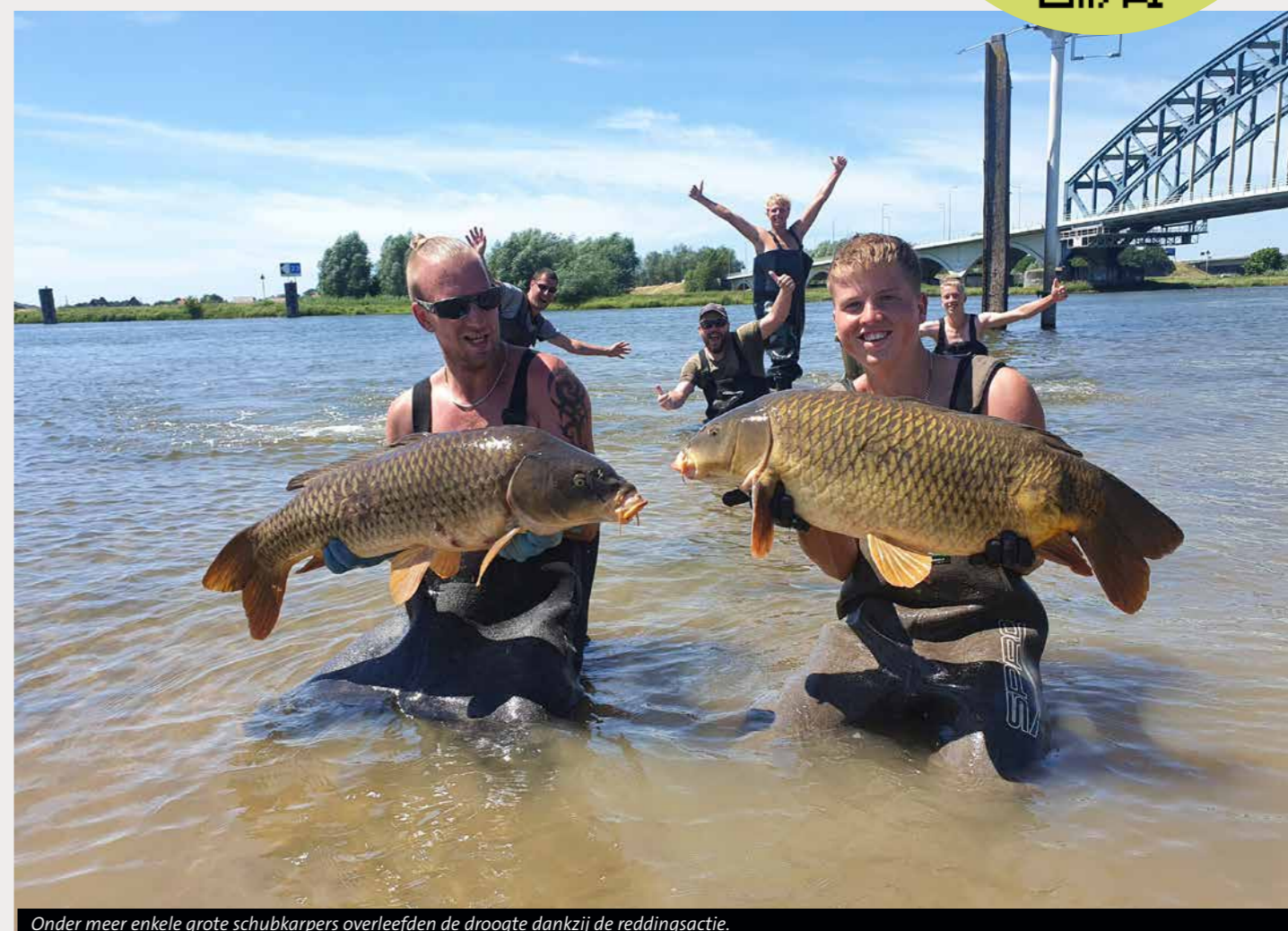
Onder meer enkele grote schubkarpers overleefden de droogte dankzij de reddingsactie.