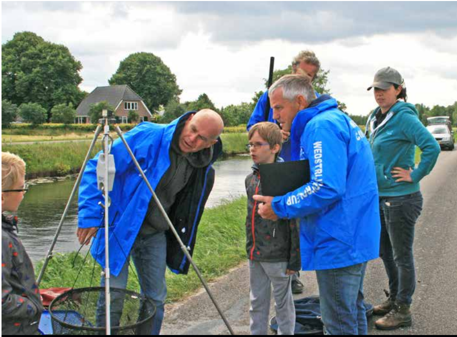
Wedstrijdcontroleurs wegen de vangst na afloop van een wedstrijd.