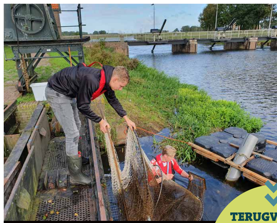
Onderzoekers aan het werk in de Vecht.

exact in beeld gebracht. Bovendien weten we hoe lang ze zich ophouden in een stuwvak en hoeveel stuwen ze per dag passeren.