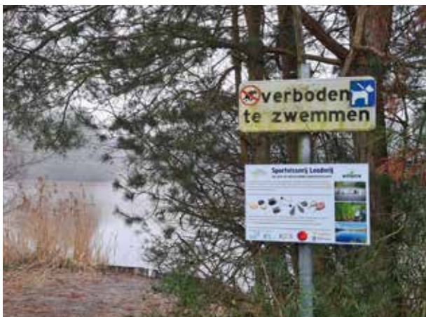
Loodvrij pilotgebied Spartelvijver

Naast deze acties hebben we loodvrij vissen onder meer bij het Junior IJselfestijn Brummen en de selectiewedstrijd Streetfishing in Zwolle gepromoot door de deelnemers gratis setjes loodvrije gewichten te verstrekken.