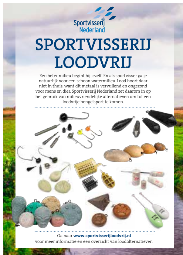
Verschillenden alternatieven zijn beschikbaar

te openen, vond er op vrijdag 25 juni een inruilactie op locatie plaats. Tussen de beide plassen in werd een grote tafel opgesteld waarop diverse alternatieven van staal, steen en verzwaard beton uitgesteld werden en waar direct lood geruild kon worden tegen deze alternatieven.