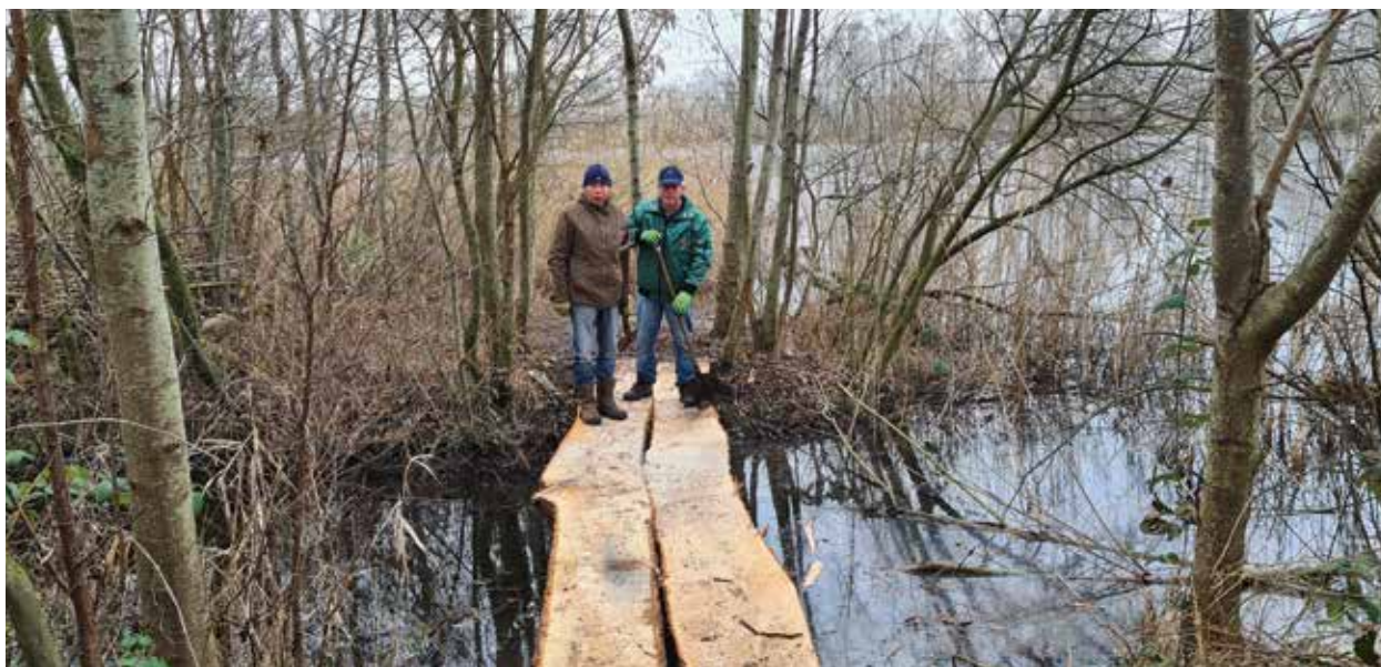
Brugdelen Bijkersplas vervangen

Hengelsportverenigingen kunnen voor dit traject viswedstrijden aanvragen via het VWRP. Wel zijn er bijzondere bepalingen die in de wedstrijdtoestemmingen opgenomen, zoals een aanrijroute en ook het parkeren in de daarvoor aangewezen parkeerhavens.