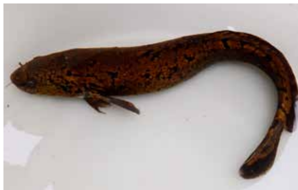
Swimway Vecht - Tijdens het onderzoek werden 19 kwabalen gevangen

In 2018 is gestart met het vier jaar durende vismigratieproject Swimway Vecht. Tijdens verschillende deelonderzoeken verzamelden we gegevens om tot een optimale migratie voor vis te komen. Denk hierbij aan vissoorten zoals de zeeforel, kwabaal, houting, paling en winde. Door vissen te zenderen en te volgen, hopen we erachter te komen waar de grootste migratiebarrières voor trekvissoorten liggen. Swimway Vecht is samenwerkingsproject waarbij waarin o.a. het waterschap Vechtstromen, Sportvisserij Oost-Nederland, waterschap Drents Overijsselse Delta, Rijkswaterstaat en diverse Duitse partijen samenwerken. De afgelopen jaren heeft Sportvisserij Oost-Nederland samen met een groep van 25 vrijwilligers een belangrijke bijdrage geleverd aan