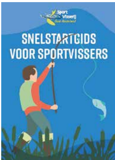
Snelstartgids voor sportvissers