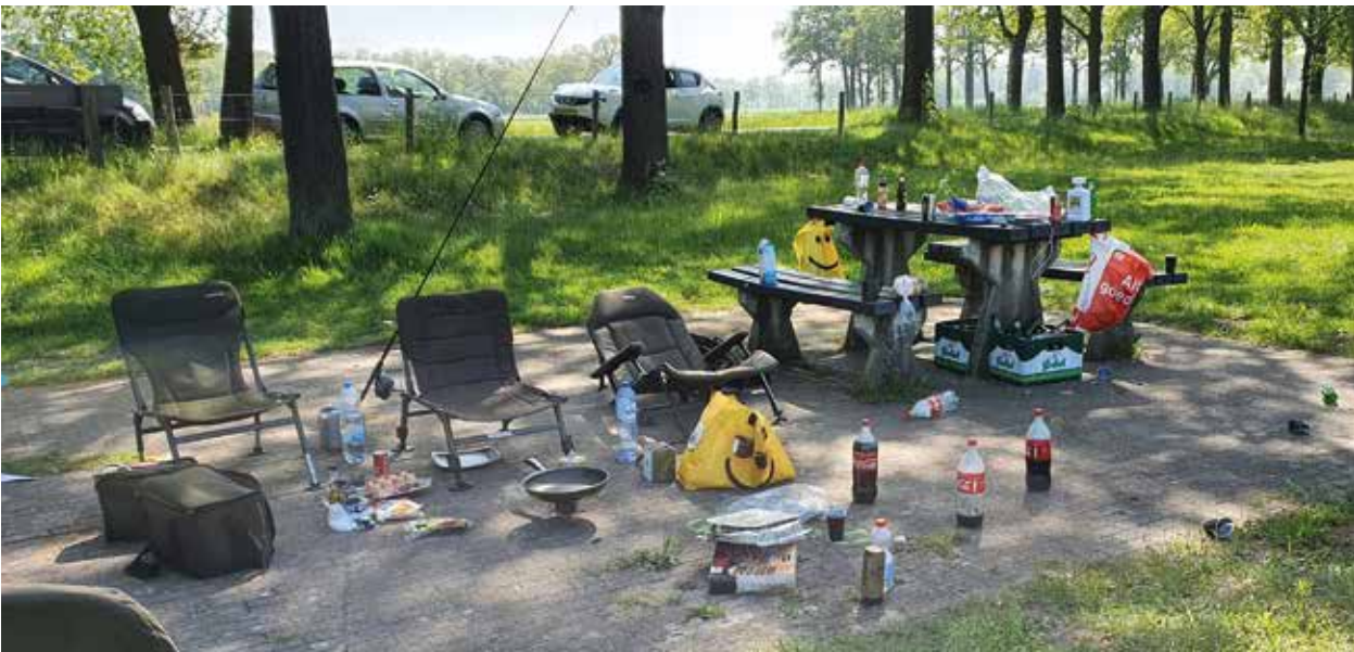
Deze situatie heeft natuurlijk weinig met vissen te maken.