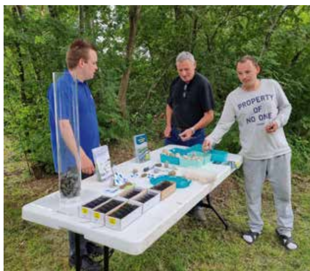
Loodvrije inruilactie Bijkersplas

In 2021 hebben we in het gebied van het waterschap Drents Overijsselse Delta een vervolg gegeven aan de pilotlocatie Bijkersplas en Brouwersgat met een aantal acties en bredere inruillocaties. Om het nieuwe seizoen van de Loodvrij Pilot op het Brouwersgat en de Bijkersplas