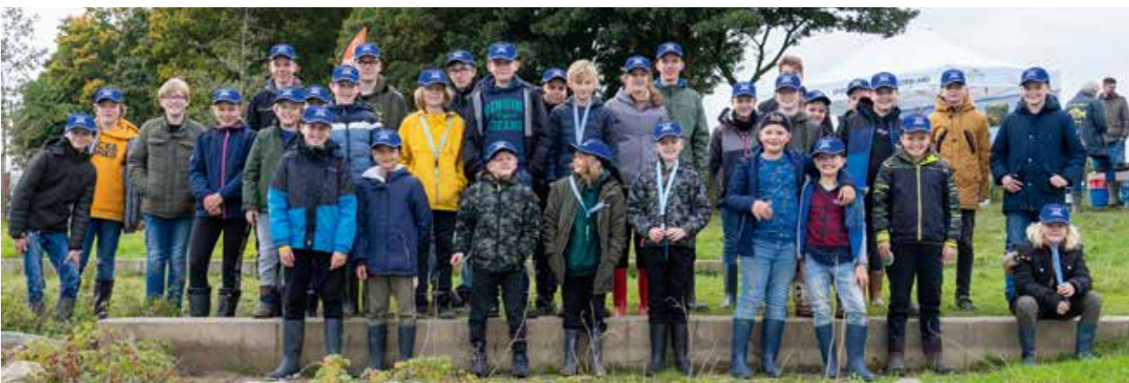
Junior IJselfestijn Brummen

Na de lunch wisselden de groepen van type visserij, zodat iedereen op beide manieren kon vissen. Ter afsluiting kregen alle kinderen een goed gevulde goodiebag en werd de dag voor de kinderen afgesloten met een ijsje. Nadat alles opgeruimd was, praatten de vrijwilligers nog even gezellig na onder het genot van een drankje en een paar bitterballen. Als bedankje kregen zij ook nog een lekker Bronkhorster Veertje mee naar huis.