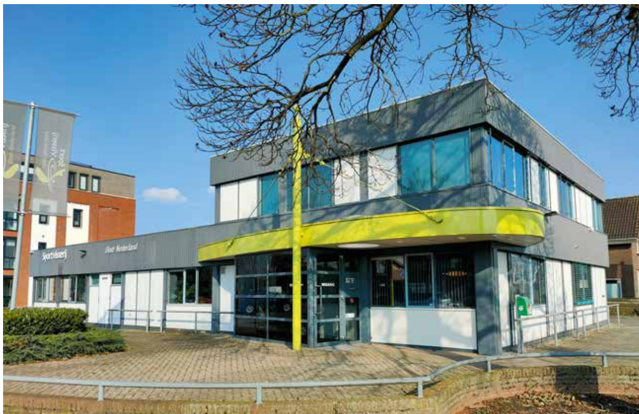
Het kantoor van SVON wordt volledig gerenoveerd

Zoals in de ALV van mei 2021 toegelicht is, hebben wij een start gemaakt met de voorbereiding van de renovatie/revitalisering van ons kantoorpand. Dit vanwege stringente duurzaamheidseisen vanuit de overheid, onze huidige hoge energiekosten (gas en elektriciteit), de aanwezigheid van asbest in de gevels en het matige interne werkklimaat van het huidige pand uit de jaren '60. Wij zijn content met de definitieve keuze voor het ondersteunend bureau m.b.t. de huisvesting en dat is SOM= uit Oldenzaal. Zij zijn een professioneel bouwkundig bureau en de projectleider komt uit Raalte zelf en kent de markt en de klappen van de zweep. Samen met hen hebben wij in 2021 een aantal voorbereidende opdrachten uitgevoerd m.b.t. onze huisvesting en voorbereiding van de verbouwing. Er heeft een nader onderzoek plaatsgevonden naar asbest in onze gevels, helaas zit hier asbest in verwerkt. Er is een constructie-berekening gemaakt van ons pand en de (on)mogelijkheden voor de verbouw, de technische installaties zijn beoordeeld en eind 2021 heeft de architect Studio.NL een eerste schetsontwerp uitgewerkt. Verder zijn er voorbereidende gesprekken met de gemeente Raalte gevoerd.