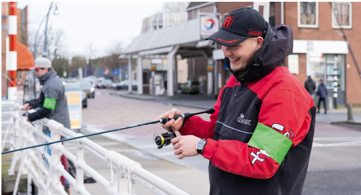
Federatief Kampioenschap Streetfishing Oost-Nederland

Na een lastige dag met op de valreep nog flink wat wind en regen, deden een broodje bal en een kom erwtensoep wonderen voor het moraal van de vissers. Immers als de vangsten niet reuze zijn, maakt een lekkere verwarmende versnapering veel goed!