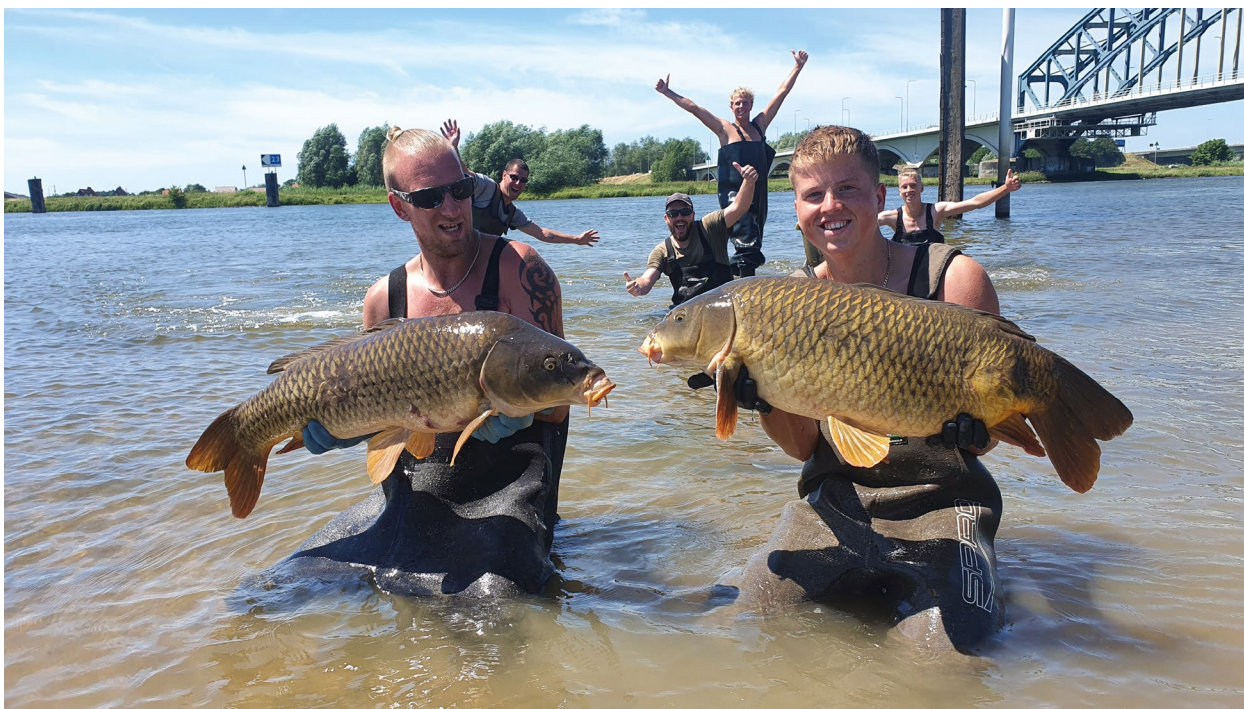
Reddingsactie bij de IJssel