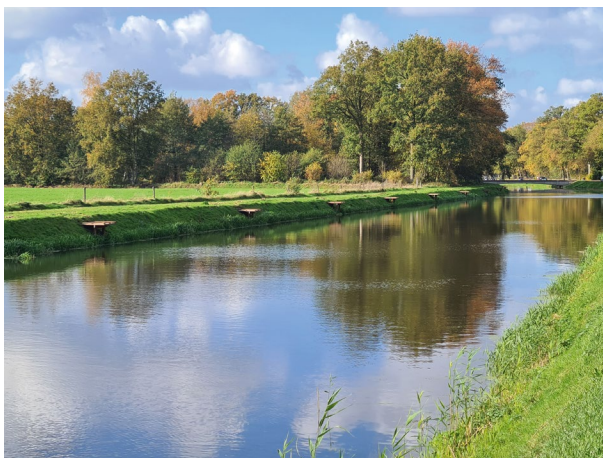
Steigers langs het wedstrijdtraject Loolee Almelo

Het wedstrijdtraject langs het Lateraalkanaal ter hoogte van de Slagenweg in het centrum van Almelo is een geliefde visplaats. Wedstrijdvisserij kunnen de auto achter hun stek parkeren en het is er rustig vertoeven. De druk op stedelijk gebied neemt echter steeds meer toe en ook langs dit traject worden op den duur huizen gebouwd. Samen met AHV Vislust Almelo hebben we alvast gezocht naar een alternatieve locatie. Na goed overleg met het Waterschap Vechtstromen is besloten om het wedstrijdtraject te verplaatsen en vissteigers aan te leggen langs de Loolee bij de Mariastuw. Auto's kunnen elkaar hier niet passeren, maar tijdens wedstrijden kunnen vissers hun auto wel direct achter de stek parkeren.