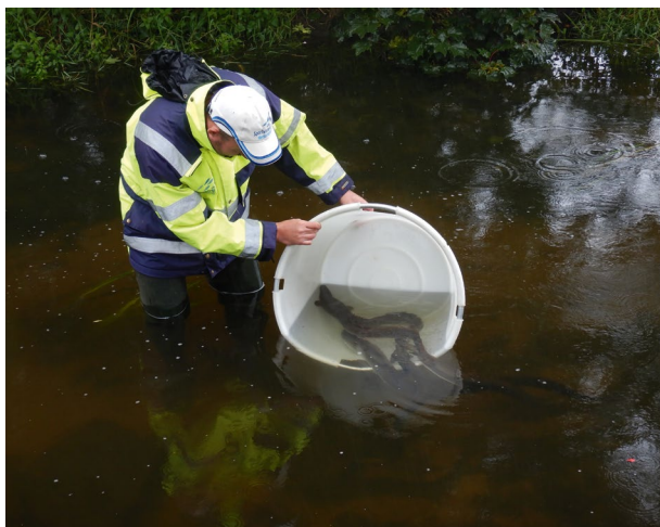
Schieraalonderzoek Swimway Vecht

De VBC Vallei en Veluwe is in 2020 enkele keren bijeen gekomen. Minder vaak dan voorgaande jaren, maar gelukkig bood digitaal vergaderen prima mogelijkheden. De afspraken rond de werkwijze 'Vissen in Nood' zijn geëvalueerd en hebben een vervolg gekregen. Er is een vervolg gegeven richting een loodvrij pilot gebied binnen het Waterschap, zijnde in het gebied van Sportvisserij MidWest Nederland. Met alle partijen binnen de VBC zijn er stappen gezet richting een nieuw VISplan, de hieruit voortvloeiende acties worden vervolgd in 2021. De beide sportvisserijpartijen binnen de VBC hebben een inspraak gedaan op het Blauwe Omgevingsprogramma van het Waterschap. Ook Sportvisserij Op de Kaart heeft een vervolg gekregen binnen de VBC door het delen van de plannen, ook hier wordt in 2021 een vervolg aan gegeven.