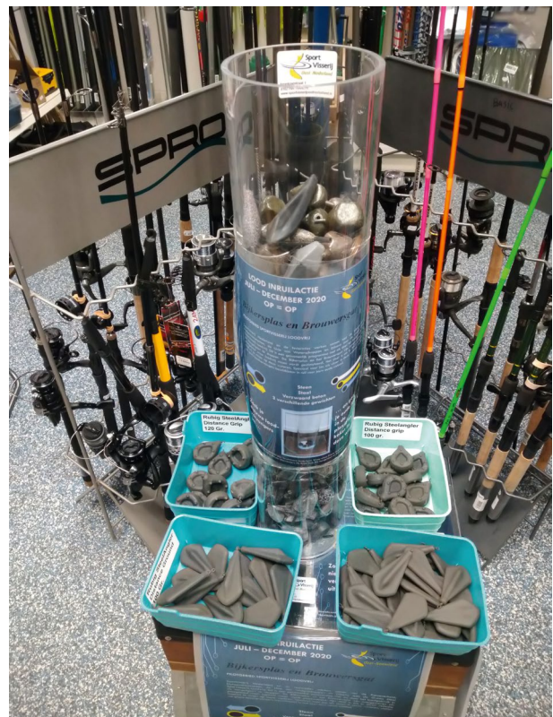
Kilo's lood werden ingeruild voor alternatieve gewichten

Gelukkig konden we wel starten met het eerste loodvrije pilotgebied van Oost-Nederland. Op 1 juli is het pilotgebied Bijkerplas/Brouwersgat geopend. Wel in een aangepaste vorm en zonder feestelijke opening. Er is direct gestart met een lood inruilactie bij Massier Diervoeders in Nieuwleusen, vlakbij de beide wateren. Ook de controleurs van HSV De Voorn Nieuwleusen hebben flink hun best gedaan, door de vissers te informeren en flyers uit te delen. Een aantal leuke