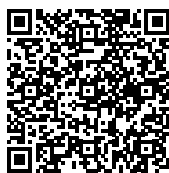
RTV Oost Nieuws

sing en zij de gemaakte onkosten vergoeden. Vaak levert dit ook een prachtig stukje positieve PR op in de media. Verscheidene keren is RTV Oost mee geweest om een dergelijke afvissing in beeld te brengen. Ons dankwoord gaat uit naar de vrijwilligers die ondanks de hitte, tot en met code oranje aan toe, in een waadpak door de modder ploeterden om vissen te redden.