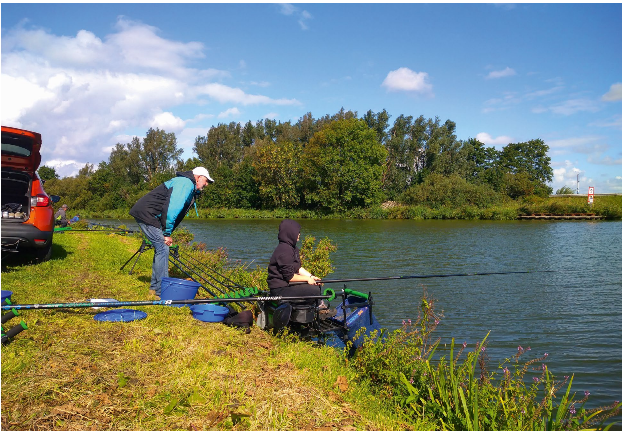
Ons damesteam doet mee met het ONK Dames

Op 3 oktober stond de volgende training in het Beukerskanaal al weer op de planning om die week daarna de derde Youth Challenge wedstrijd, eveneens in het Beukerskanaal, te vissen. Beide teams lieten zich goed zien met als uitschieter Keano met zijn 3de plek bij de U15.