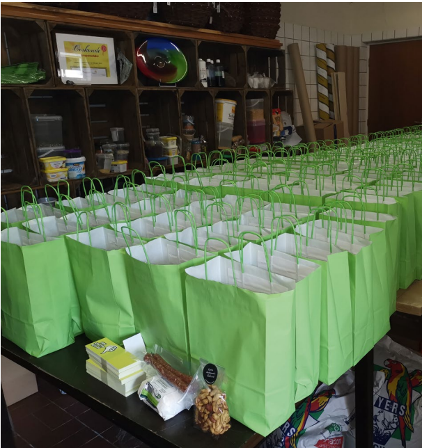
Streekpakketten voor onze vrijwilligers..

Op onze vraag naar sportvisserijcontroleurs kwamen maar liefst ruim 80 aanmeldingen binnen! Een groot succes dus, ware het niet dat de door Sportvisserij Nederland te organiseren cursussen helaas niet door konden gaan vanwege de coronamaatregelen. Een oplossing werd gezocht in online cursussen. Ditzelfde gold voor de aanmeldingen die we ontvingen van mensen die wedstrijdcontroleur willen worden. We hopen deze kandidaten bij de start van het wedstrijdseizoen 2021 actief te kunnen inzetten.