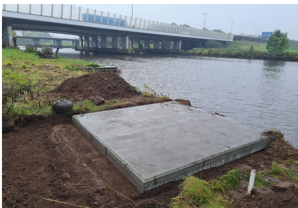
Stelconplaten langs de Vecht bij Zwolle

Sinds 2018 zijn we samen met De Hengelsport Zwolle bezig om een alternatieve wedstrijdlocatie aan de Overijsselse Vecht te realiseren. Het eerdere traject langs de Vecht ter hoogte van de A28, beter bekend als Bongers, werd steeds lastiger te bevissen. Met name door geplaatste rasters om ganzen tegen te houden, was de oever niet meer toegankelijk. In goed overleg met dhr. Pruijm, pachter van het land aan de overzijde van de Vecht t.h.v. de trailerhelling, pacht De Hengelsport nu een strook land ten behoeve van de sportvisserij. De Hengelsport Zwolle onder-