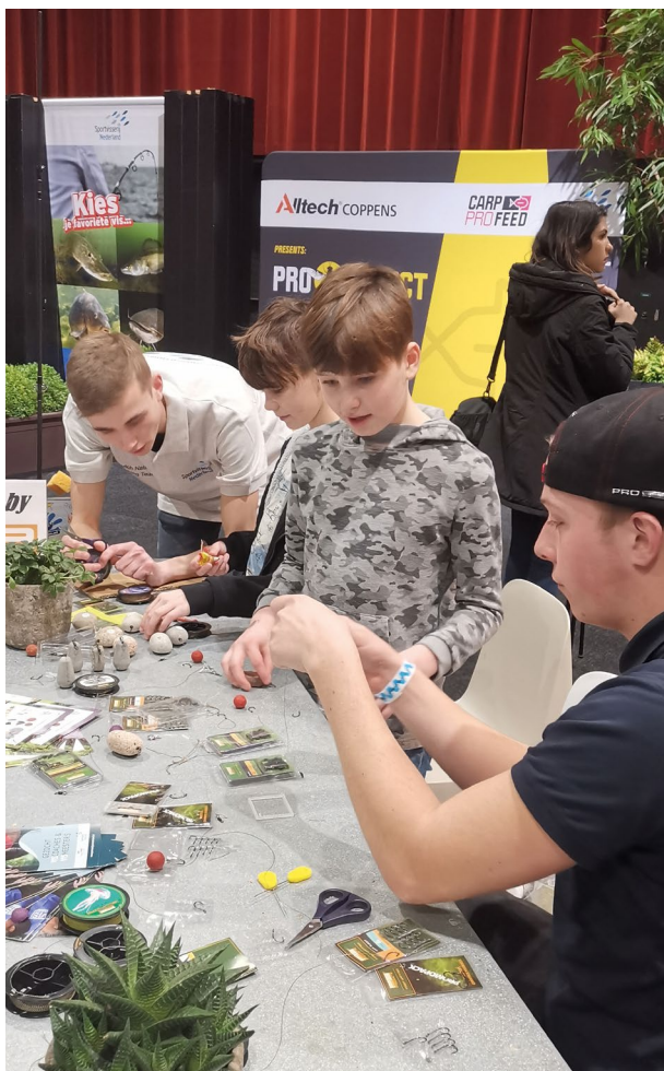
Jeugd leert een rigje knopen op Carp Zwolle

Gelukkig kon in de zomer nog wel de ZomerVISkaravaan plaatsvinden en zijn de voorbereidingen voor het project Samen Vissen alvast gemaakt voor een volgend jaar. Deze voorbereiding geldt ook voor de excursies bij de historische aalstal in IJhorst. De jeugdroofvisdag van de Snoekstudiegroep kon in september ook doorgaan. Aan publiciteit ontbrak het ons gelukkig niet. Ook in Oost-Nederland werd veel aandacht besteed aan sportvissen en we kwamen in het nieuws tijdens reddingsacties. Natuurlijk brachten we de sportvisser weer op de hoogte via de regio-edities van Hét VISblad en droegen we bij aan enkele artikelen in magazines. Onze website is opgefrist en de sociale media-kanalen werden regelmatig ingezet.