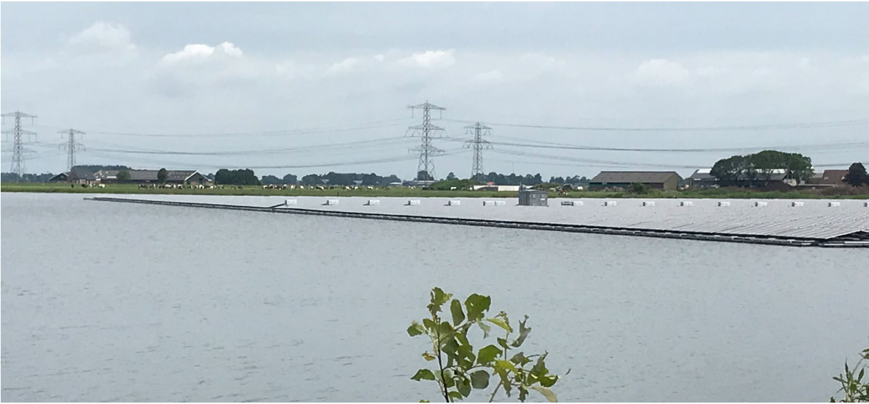
Zonnepark op de Sekdoornse Plas bij Zwolle