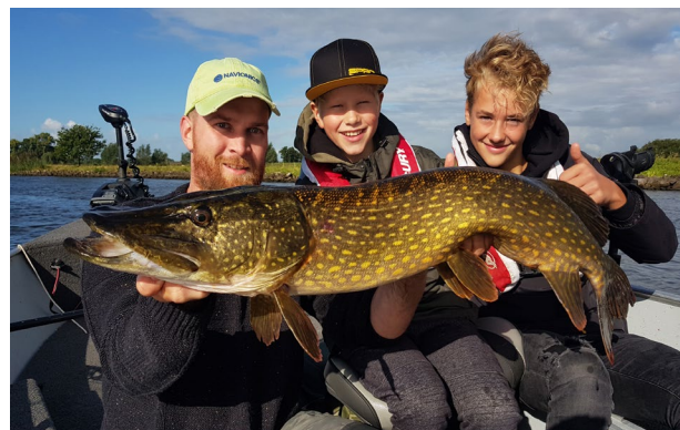
Een prachtige snoek tijdens de jeugdroofvisdag in Zwolle

De SNB bedankt alle vrijwilligers van harte voor hun inzet. Een visdag opofferen in misschien wel de beste vistijd van het jaar om "onze toekomst" te laten vissen, dat is altijd weer bijzonder om te zien.