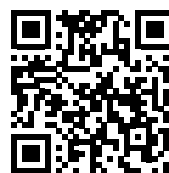
Afvissing in beeld