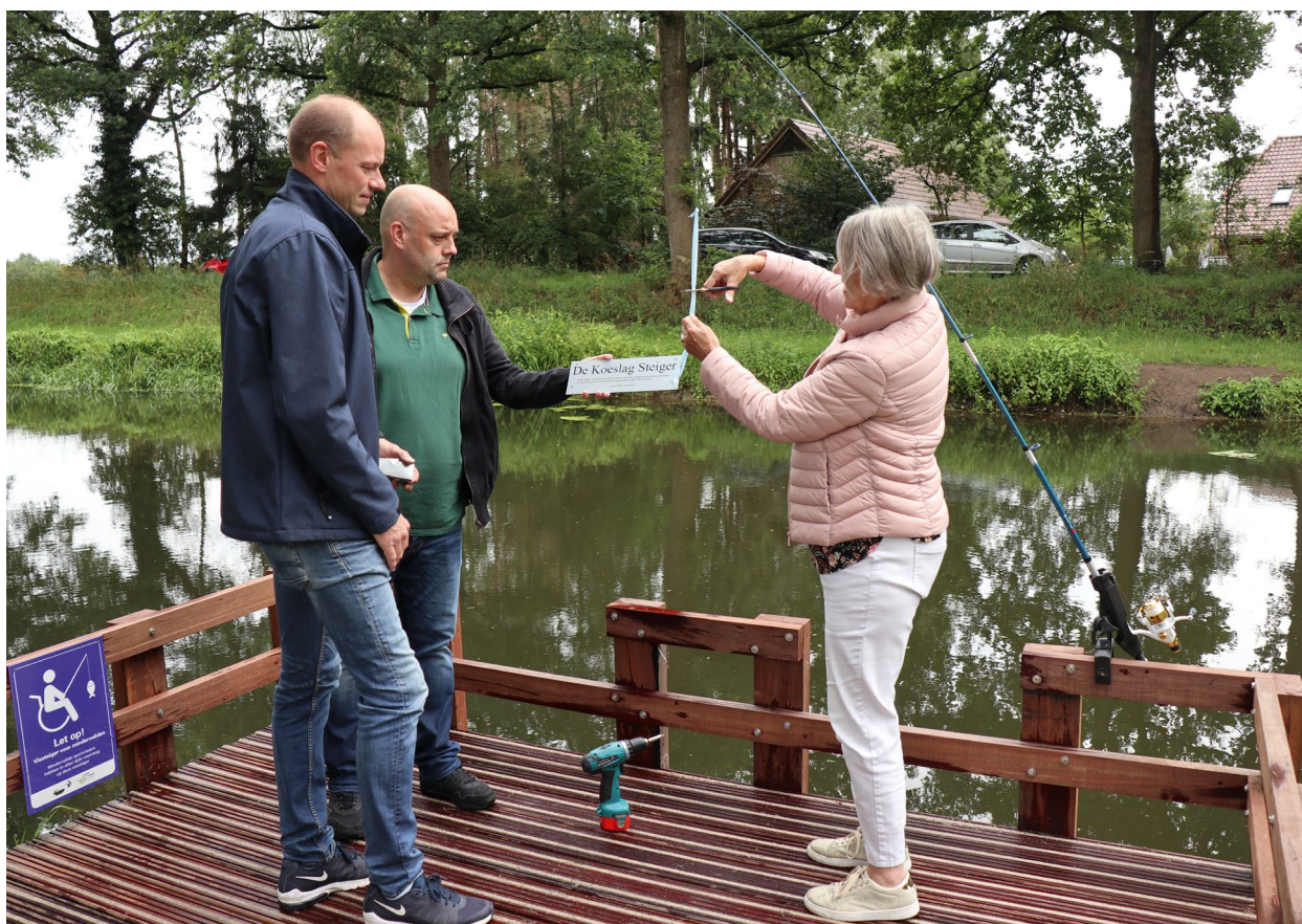
Koeslag steiger in Bathmen