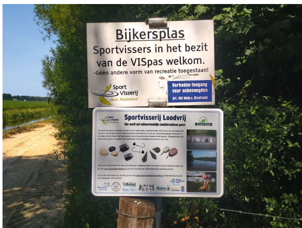
De Bijkersplas en het Brouwersgat zijn loodvrije pilotgebieden

Om een zo breed mogelijk publiek ervan te doordringen dat lood niet in het milieu thuis hoort, hadden we in februari tijdens de beurzen Carp Zwolle en Faszination Angeln in Lingen een tafel met loodvrije alternatieven en (Duitstalige) flyers Sportvisserij Loodvrij ingericht. Hier werd regelmatig een kijkje genomen. Opvallend was dat veel bezoekers al jaren loodvrij vissen met veelal zelfgemaakte alternatieven. Het assortiment loodvrije producten is inmiddels behoorlijk uitgebreid evenals het besef bij de sportvisser dat lood niet in de natuur thuis hoort, ook over de grens bij onze Duitse oosterburen.