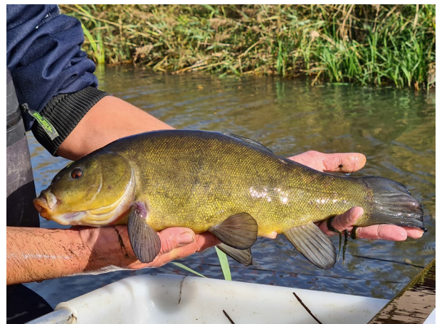
Een prachtige zeelt als vangst bij visserijkundig onderzoek

2020 gaat de boeken in als het meest bijzondere monitoringsjaar tot op heden. Terwijl we in de startblokken stonden voor het naderende monitoringsseizoen, werd dit vanwege de coronacrisis al gauw een halt toegeroepen en konden alle materialen weer in de stalling. We hebben 2 dagen voor Vallei & Veluwe onderzoek kunnen doen en een klus voor Hengelsportvereniging Ons Genoegen te Wierden. De uitdaging bij deze laatste klus zat hem vooral in het vangen en verwijderen van een Europese meerval uit een afgesloten water en dat is gelukt!