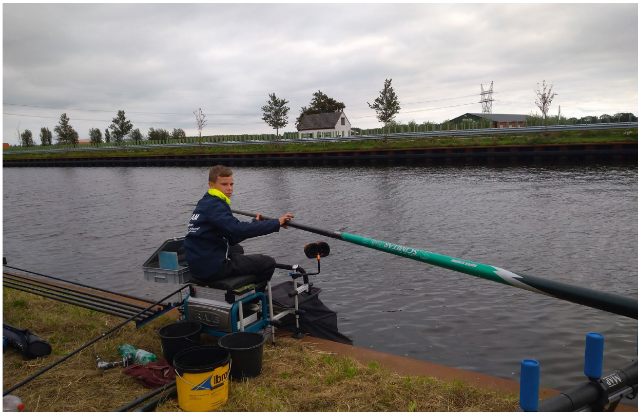
Jeugd in actie op TTC Noordhollandsch Kanaal