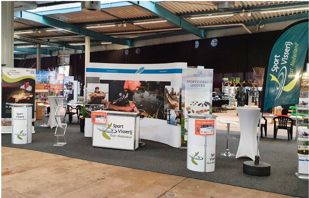
Faszination Angeln Lingen

Dat je een heel jaar in zo'n 90% van de Nederlandse wateren mag vissen met een VISpas tegen een relatief laag bedrag, vindt men een goede zaak. Dat is in Duitsland vaak anders. Onder de wat jongere vissers zien we een flinke stijging in het gebruik van de VISplanner app.