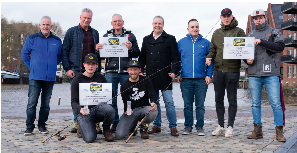
Winnaars Federatief Kampioenschap Streetfishing met enkele organisatoren en wethouder Dogger

De prijsuitreiking werd gedaan door wethouder Dogger van de gemeente Zwolle. De top 3 teams kregen een geldprijs en het team dat eerste werd, kreeg per persoon ook nog een mooie glaskokaal! Voor de nummers 4 tot en met 10 waren er materiaalprijzen te winnen, afkomstig van hengelsportzaak Zunnebeeld.