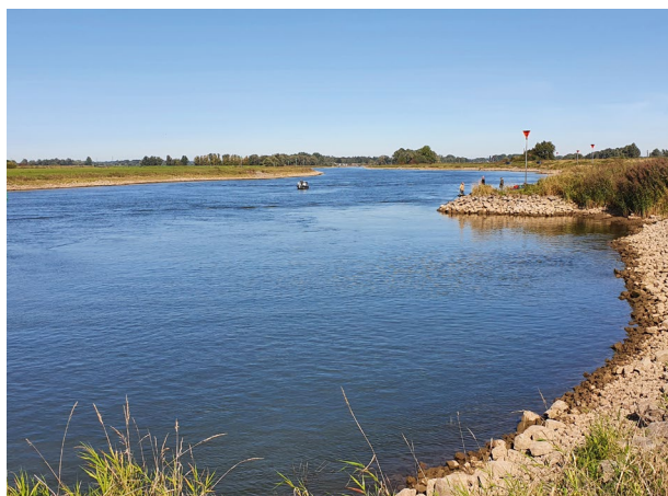
Controleactie op de IJssel

Helaas bleek het doel om alle vissers te controleren iets te ambitieus. Er werd vanwege het aangename nazomerweer bijzonder veel gevestig. In totaal zijn 178 sportvissers gecontroleerd. Bijna alle sportvissers (170) hadden alles in orde. Er is 8 keer een bekeuring aangezegd. 6 keer voor het vissen zonder een VISpas (of het niet naleven van de vergunningsvoorwaarden), 1 keer voor het vissen met een verboden vistuig en 1 keer voor het vissen met een levende aasvis.