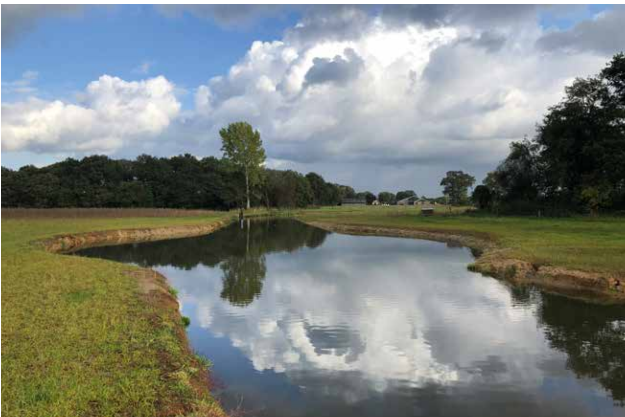
Opening Reggedal Enter

In de regio-editie van december werd de heringerichte Regge mooi in beeld gebracht. Het deelonderzoek naar windetrek in het project Swimway Vecht werd belicht en we lieten de lezer kennismaken met de twee in 2019 aangestelde jeugd wedstrijdcoaches. Ook publiceerden we het succesverhaal van HSW Zwartewaterland waar mooie visvlonders zijn aangelegd.