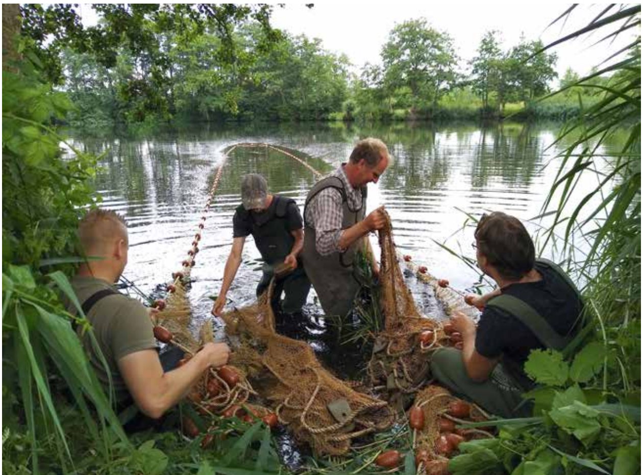
Reddingsactie in Hengelo

Belangrijk thema binnen de VBC Rijn en IJssel was opnieuw de droogte. Er zijn enkele reddingsacties geweest, echter op