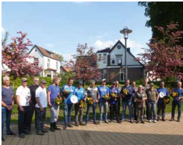
Prijswinnaars Federatief Kampioenschap Dobbervissen heren en teams

Op zaterdag 18 mei werden in het Beukerskanaal gelijktijdig de eerste twee selectiewedstrijden van het nieuwe seizoen gevestigd. Beide wedstrijden werden ook gevestigd als Federatief Kampioenschap.