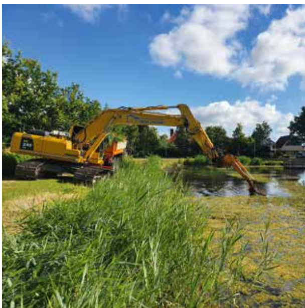
Sierwateren worden beter bevisbaar

In de waterschapsgebieden van Drents Overijsselse Delta, Rijn en IJssel en Vallei en Veluwe zijn we gestart met het project Sportvisserij op de Kaart. In samenwerking met de waterschappen is er een aanpak omarmd, waarbij op basis van jaarlijkse