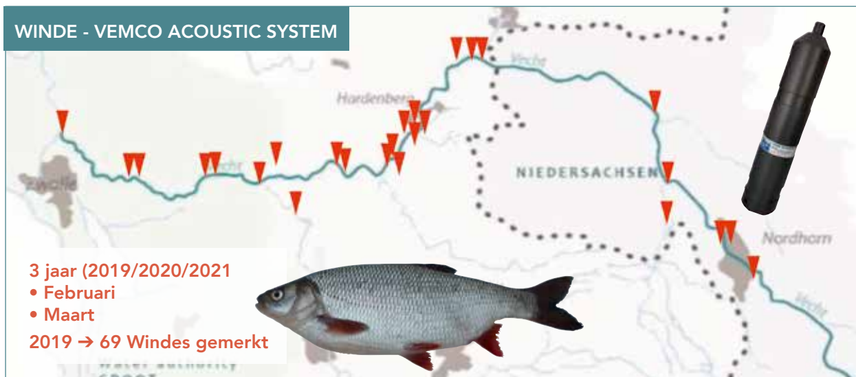
Swimway Vecht - overzicht meetlocaties

Na de grote problemen in 2018 ten aanzien van de visstand in vele wateren in Oost-Nederland werden we ook de afgelopen zomer weer geconfronteerd met droogvallende wateren en vissen in nood. Gelukkig konden we ook enkele sportvisserijmogelijkheden uitbreiden en extra viswateren toevoegen aan de Gezamenlijke Lijst van Nederlandse Viswateren. Ook gaf de Overijsselse Vecht een paar bijzondere geheimen prijs tijdens de deelonderzoeken van het vierjarige project Swimway Vecht.