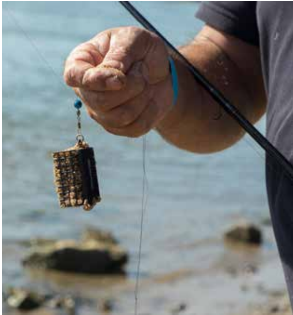
Tijdens evenementen wordt loodvrij gevist

Naast de verschillende evenementen, wedstrijden en presentaties wordt achter de schermen gewerkt aan de eerste loodvrije pilotlocatie in ons gebied. In het voorjaar van 2020 worden in samenwerking met de gemeente Ommen en het Waterschap Drents Overijsselse Delta de Bijkerplas en Brouwersgat aangewezen als loodvrij gebied. Ook zijn inmiddels in andere waterschapsgebieden de eerste stappen gezet richting mogelijke pilotlocaties.