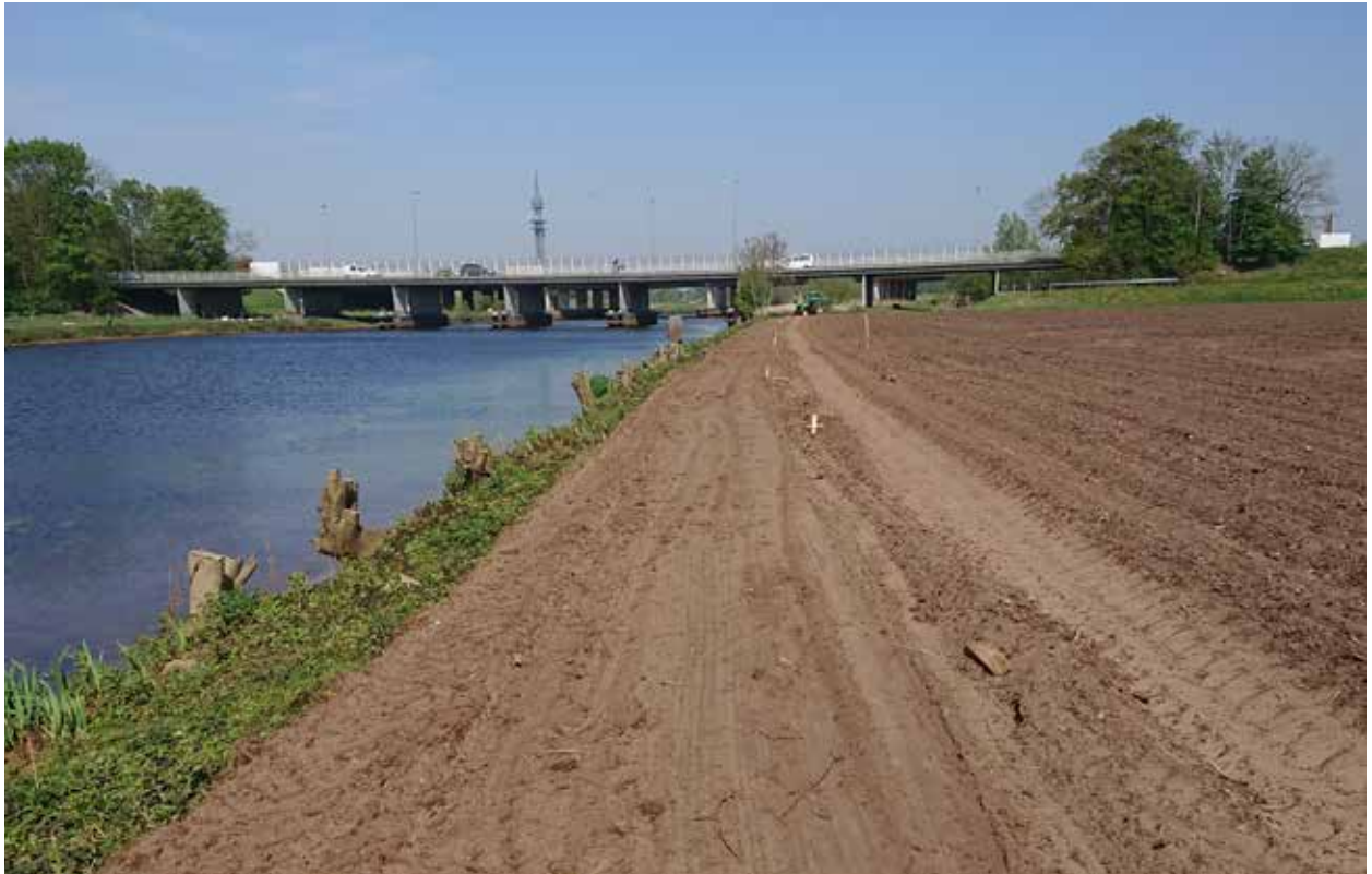
Wedstrijdtraject Vecht Zwolle