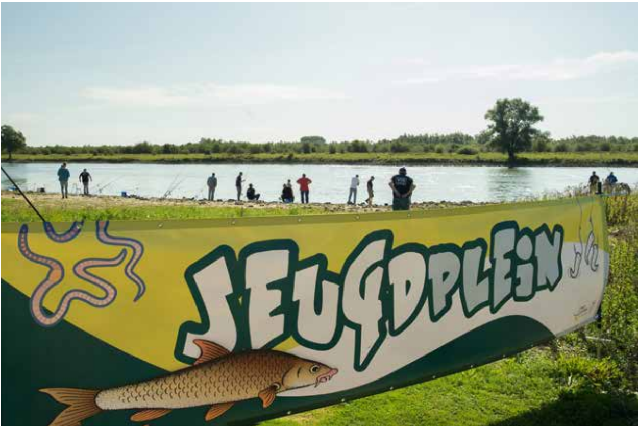
Barbeeldag - Jeugdplein