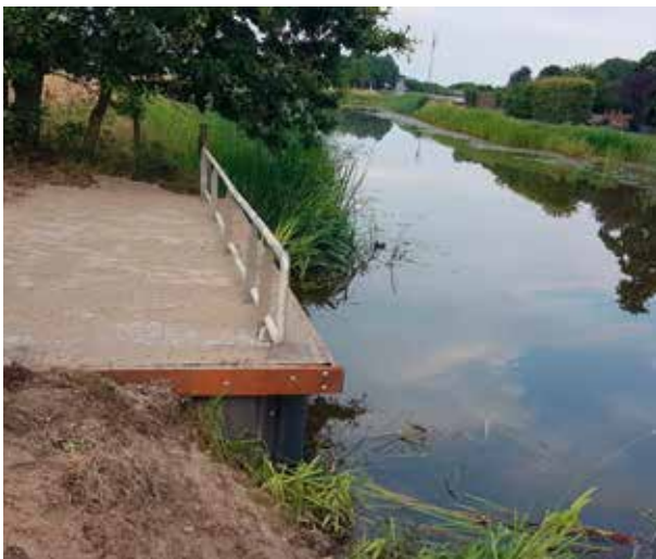
Mindervaliden vissteiger Steenwijk

Bij Zwolle hebben we door goede afspraken met de grondeigenaar een nieuw wedstrijdtraject weten in te richten langs de Vecht onder de A28. Samen met Visserijvereniging De Hengelsport Zwolle pachten we een strook grond aan weerszijden van de brug, waardoor er voldoende ruimte is om wedstrijden te organiseren. De bedoeling is om hier in de nabije toekomst Stelcon-platen neer te leggen om vaste verharde visplaatsen te creëren. In 2020 gaan we verder om deze voorzieningen gerealiseerd te krijgen.