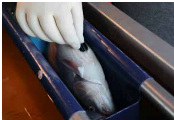
Winde wordt gezenderd

In de Vecht vanaf de monding in het Zwarte Water tot en met Nordhorn in Duitsland zijn 32 hydrofoons geïnstalleerd, die signalen van de VEMCO-zenders kunnen ontvangen. Bij het uitlezen van de ontvangers bleken uiteindelijk maar liefst 330.000 signalen te zijn opgeslagen. De windes zijn tijdens de hoge afvoeren in maart de rivier opgetrokken voorbij de zes stuwen die in het Nederlandse deel staan. Opvallend is dat het aantal gezenderde windes in gelijke verhouding afnam in stroomopwaartse richting. Niet één specifieke paaiplaats dus