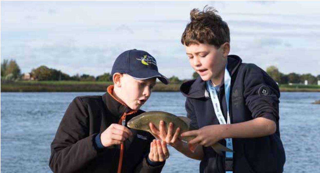
Junior IJselfestijn Deventer