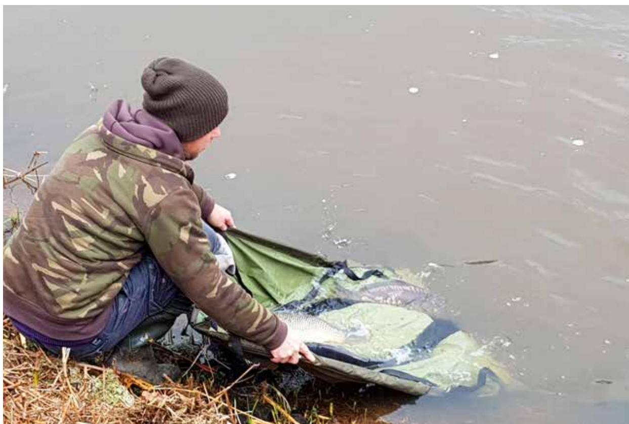
Karperuitzet in de Schipbeek

Het Twentekanaal is wederom voorzien van 380 kg karper. De uitzet vond plaats in de zijtak van het kanaal in de omgeving van Bornerbroek. Onder grote belangstelling werden de karpers, geleverd door Special Carp, vastgelegd op de gevoelige plaat. Ook de twee andere stuwvanden zijn voorzien van karper. RTV Oost was aanwezig om een reportage te maken.