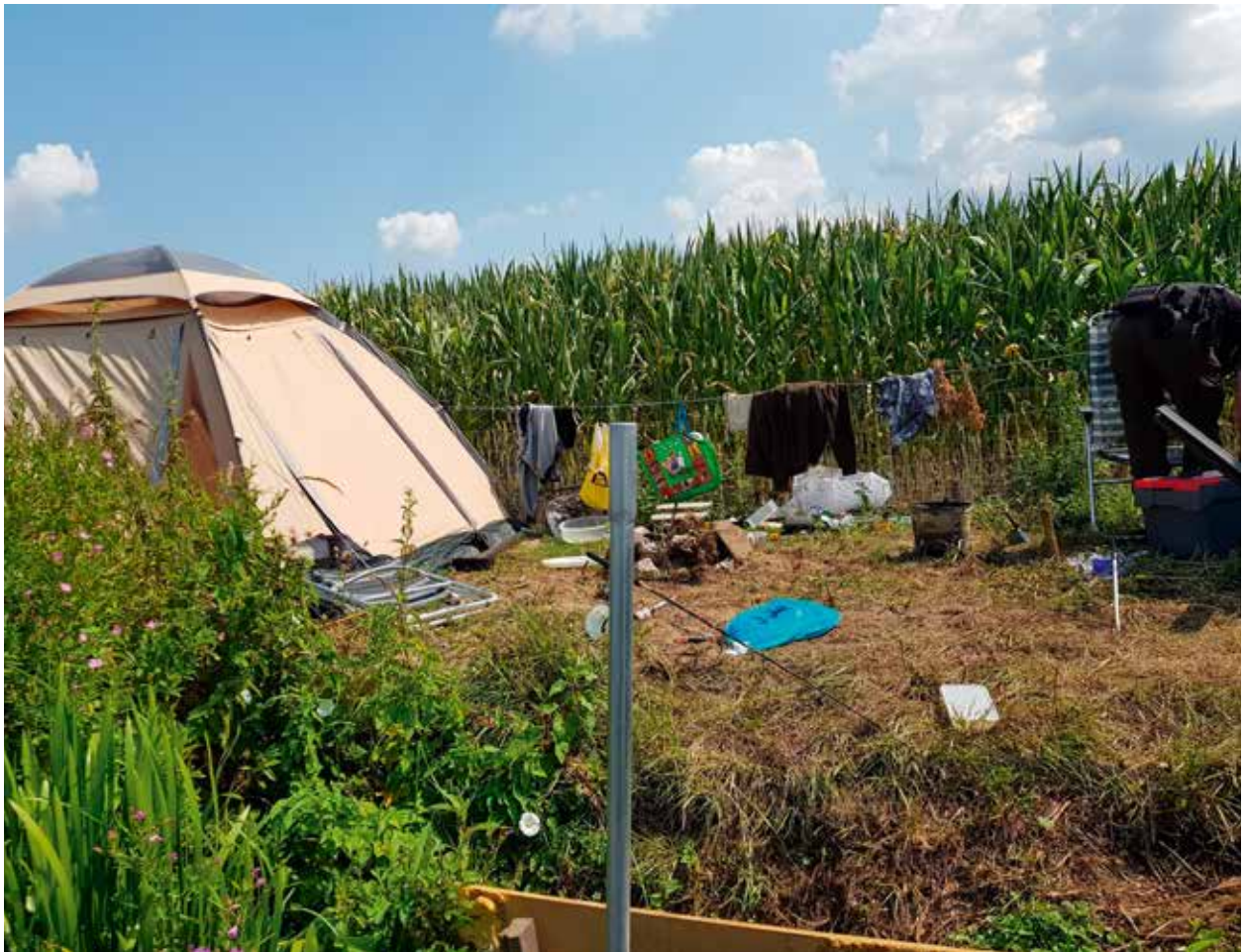
Rommel en vuurplaats langs de Vecht

Sportvissers fungeren als oren en ogen in het veld van de georganiseerde hengelsport, maar ook de gewone burger kan visstroperij melden via de site www.meldvisstroperij.nl . De link is tevens te vinden op de achterkant van de VISpas. Meldingen die gedaan worden, komen rechtstreeks binnen bij de betreffende federatie. Deze kan de melding zelf oppakken d.m.v. inzet van eigen boa's of door de melding door te zetten naar andere opsporingsinstanties. In 2019 zijn er 10 meldingen in Oost-Nederland binnengekomen. Deze hadden voornamelijk betrekking op het meenemen van vis door buitenlandse vissers. Het meenemen van vis is tot op zekere hoogte niet verboden. Dat was niet bekend bij alle melders. Vissers uit het buitenland kennen een andere cultuur t.a.v. het meenemen van vis dan wij. Andere meldingen waren "vissen in een beschermd natuurgebied", "vissen met een levende vis als aas" en het "meer snoekbaarzen voorhanden hebben dan is toegestaan". Op dit laatste feit is behoorlijk ingezet, echter zonder noemenswaardig resultaat.