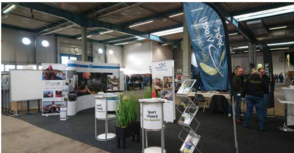
Faszination Angeln Lingen

Speciaal voor de jongste beursbezoekers waren op beide beurzen VISmeesters aanwezig om samen een tuigje te maken of een rigje te knopen. Wie een tuigje of rigje had gemaakt, mocht het meenemen om zelf mee te gaan vissen en kreeg voor zijn of haar inzet ook nog een leuke gadget mee naar huis. Op Carp was het zoals gebruikelijk druk bij de visdrilmachines, waarmee je kunt ervaren hoe het is om een krachtmeting aan te gaan met vissen van verschillende formaten.