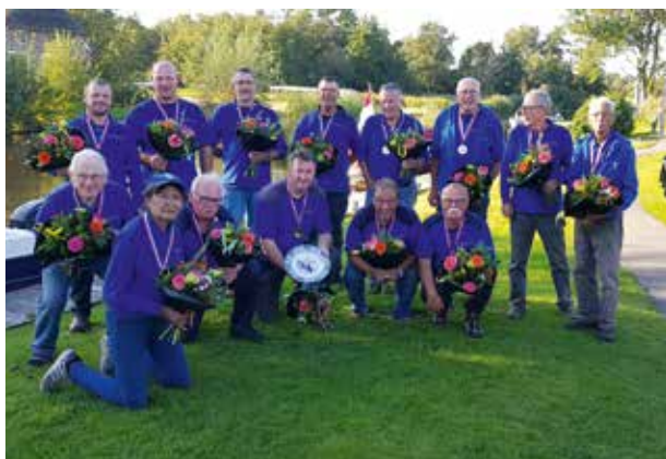
Federatief Clubkampioenschap 2019

Helaas hebben we moeten constateren dat er steeds minder animo is voor het Federatief Clubkampioenschap. Op zaterdag 21 september werd de finalewedstrijd van het Federatief Clubkampioenschap tussen de winnaars van de rayons uit Oost-Nederland gevestigd om een van de 2 plekken in de landelijke finale te bemachtigen. Visserijvereniging De Hengelsport Zwolle werd Federatief Kampioen en HSV Het Vette Baarsje Hoogeveen behaalde de tweede plek. Beide teams eindigden op respectievelijk de 10e en 7e plaats in de landelijke finale op 26 oktober in de Lage Vaart bij Almere.