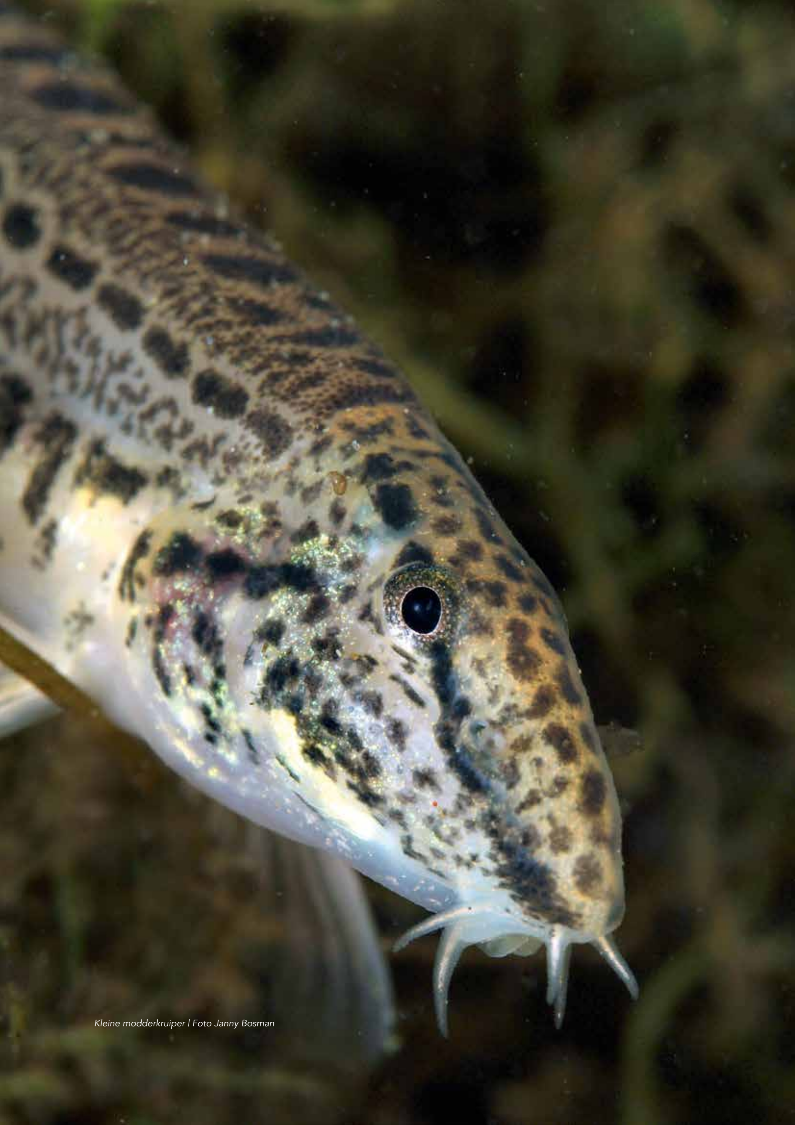
Kleine modderkruiper