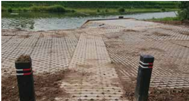
MUP geschikt voor mindervalide vissers

Omdat het in principe een maaiseluitdraaiplateau is, kan het een enkele maal voorkomen dat de plateaus slechter toegankelijk zijn vanwege maaiwerkzaamheden.