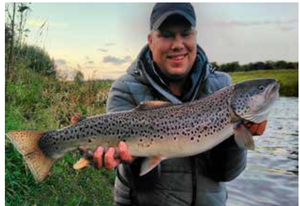
Zeeforel terug in de Vecht

hengel ook enkele grote exemplaren door verschillende sportvissers gevangen in andere stuwvak van de Vecht. Naast deze vangstmeldingen krijgen we ook steeds vaker meldingen van meerval in de Vecht.