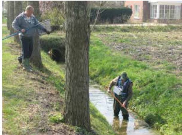
De kleinste watergangen worden bevestigd met de DEKA

en in het najaar. Bij onderzoeken waarbij een zegen moet worden ingezet, werkt onze stichting samen met een onderzoeksbureau. Een samenwerking op het gebied van materiaal en mankracht, die voor beide partijen een win-winsituatie oplevert.