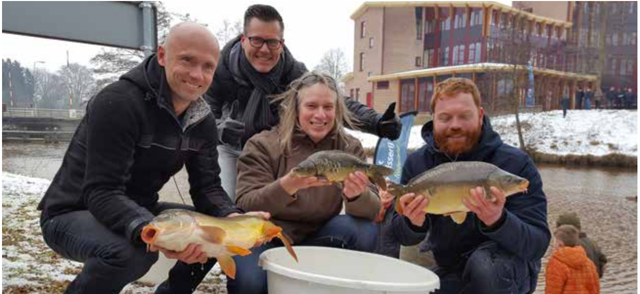
Uitzet karpers Vechtstromen