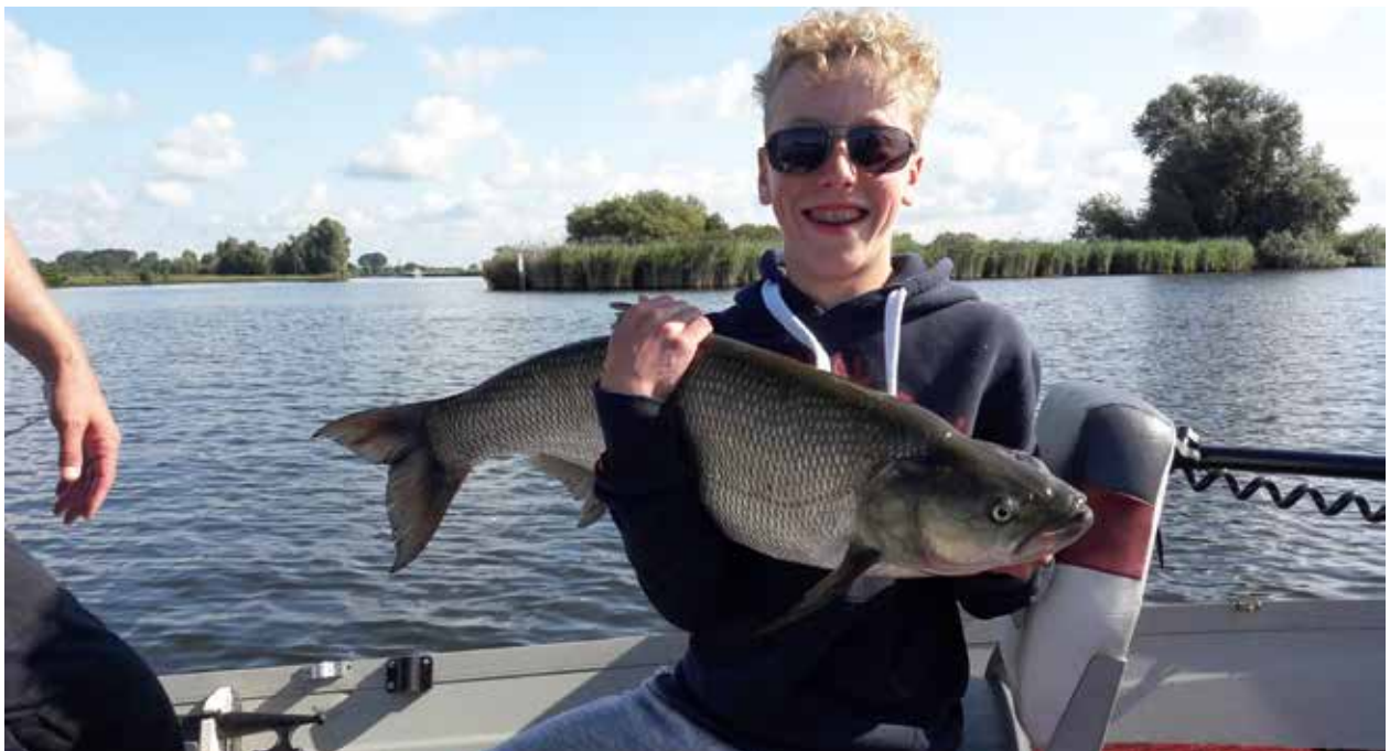
Verrassende vangst tijdens jeugdroofvisdag

Onder meer de Valkenier, de Imkervereniging en de Jachthondenopleiding dragen hun steentje bij. Natuurlijk kan de hengelsport niet ontbreken als het gaat om natuurbeleving. Onze vismeesters wisten op 11 en 12 september de aanwezige kinderen weer mateloos te boeien met een verkorte visles. Ook nu waren er weer veel kinderen, die al wel eens gevestigd hadden en die ook wel wat soorten vissen konden herkennen. Uiteraard hebben onze vismeesters meteen van de gelegenheid gebruik gemaakt om de "vislessen op de basisschool" onder de aandacht van de meegekomen docenten te brengen.