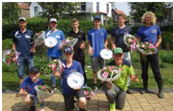
Overall winnaars junioren

Op zaterdag 3 juni waren de junioren aan de beurt. Jongens en meiden tot 25 jaar visten in het Beukerskanaal in 3 categorieën om zowel het federatieve kampioensbord als om een plek op het Open NK voor junioren. In tegenstelling tot 2016 moesten meisjes zich het afgelopen jaar wel weer plaatsen via de selecties.