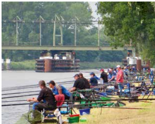
Open NK senioren