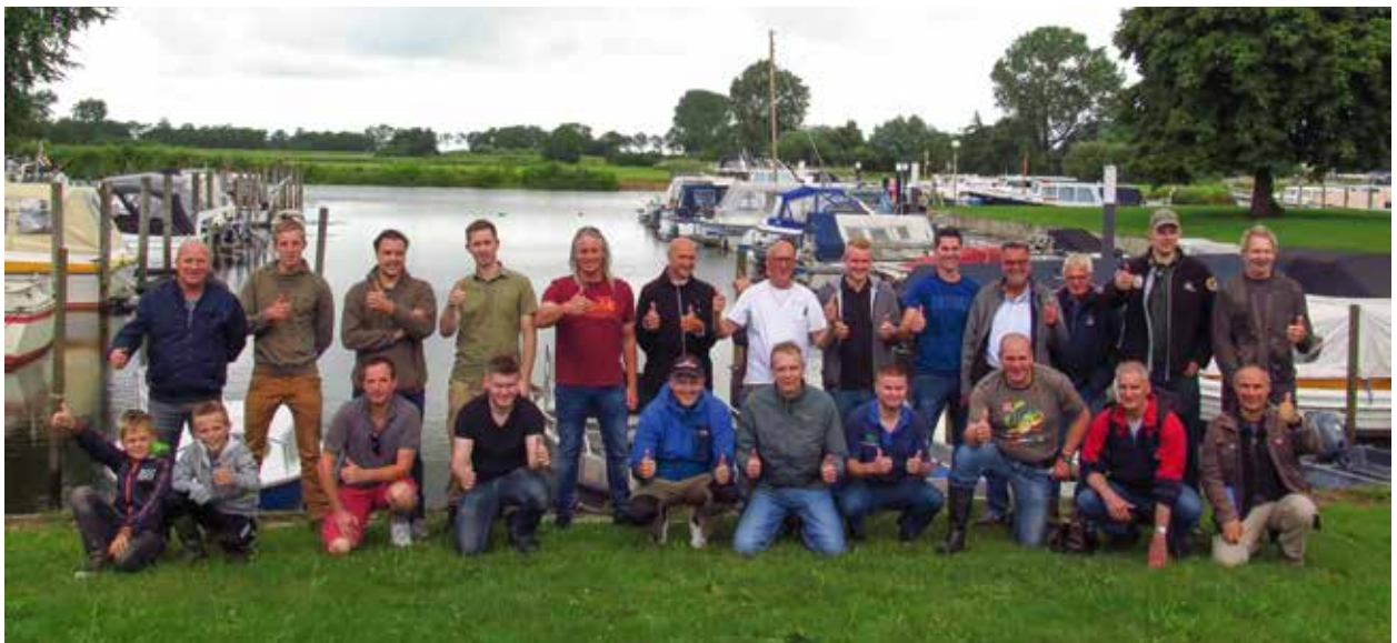
Vakbekwame visgidsen met hun gasten en de docenten

Het spannende sluitstuk van de cursus vond plaats op zaterdag 15 juli. De Overijsselse Vecht en de stad Zwolle vormden het decor voor de visgidsen en hun gasten. Met de kajak, struinend langs de oever, in volledige karperuitrusting en met de boot werd er gevist op karper, roofvis en verschillende soorten witvis. Het werd letterlijk en figuurlijk een geslaagde dag met veel enthousiasme, een goede energie, plezier, gevangen vis, blije gasten en tevreden assessoren.