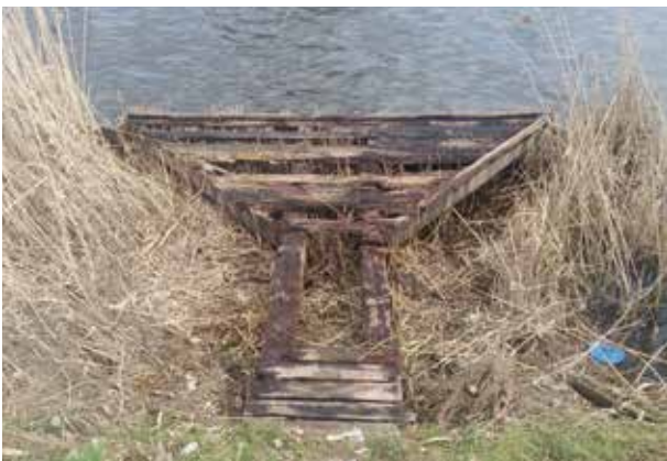
Vissteigers Twentekanaal - oud en gevaarlijk

Naar verwachting blijven de vissteigers de komende jaren goed te gebruiken. Het Rijksoverheidsproject verruiming Twentekanaal (uitvoering medio 2017 – 2020) zal hier niets aan veranderen. De ontwerpschetsen laten weliswaar zien dat de damwand op deze locatie wordt verstevigd, maar Rijkswaterstaat verwacht goed om de steigers heen te kunnen werken. Mocht er een steiger moeten worden afgebroken, dan is Rijkswaterstaat verplicht om de vissteiger in dezelfde staat terug te plaatsen.