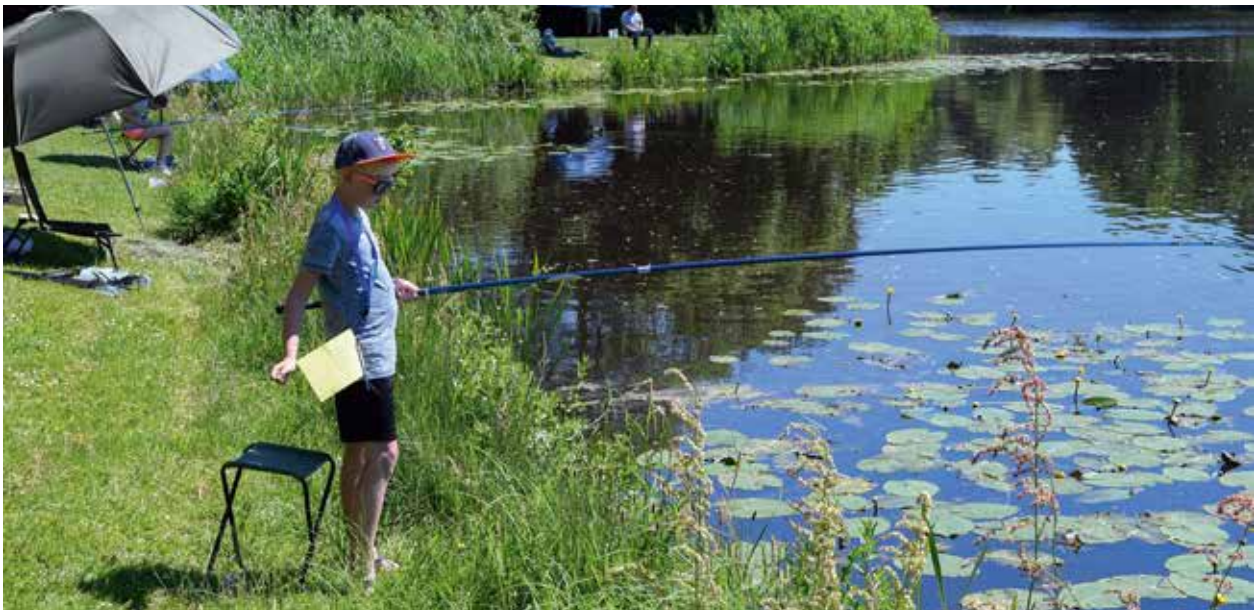
Vissen met een vaste stok