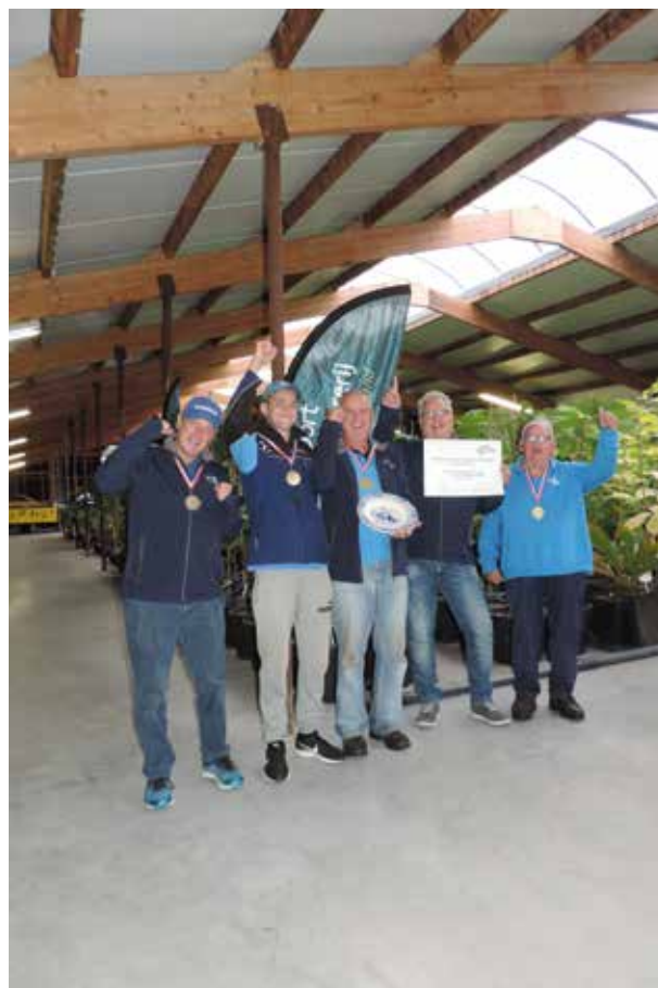
HSV De Dobber Hardenberg Federatief Kampioen 2017