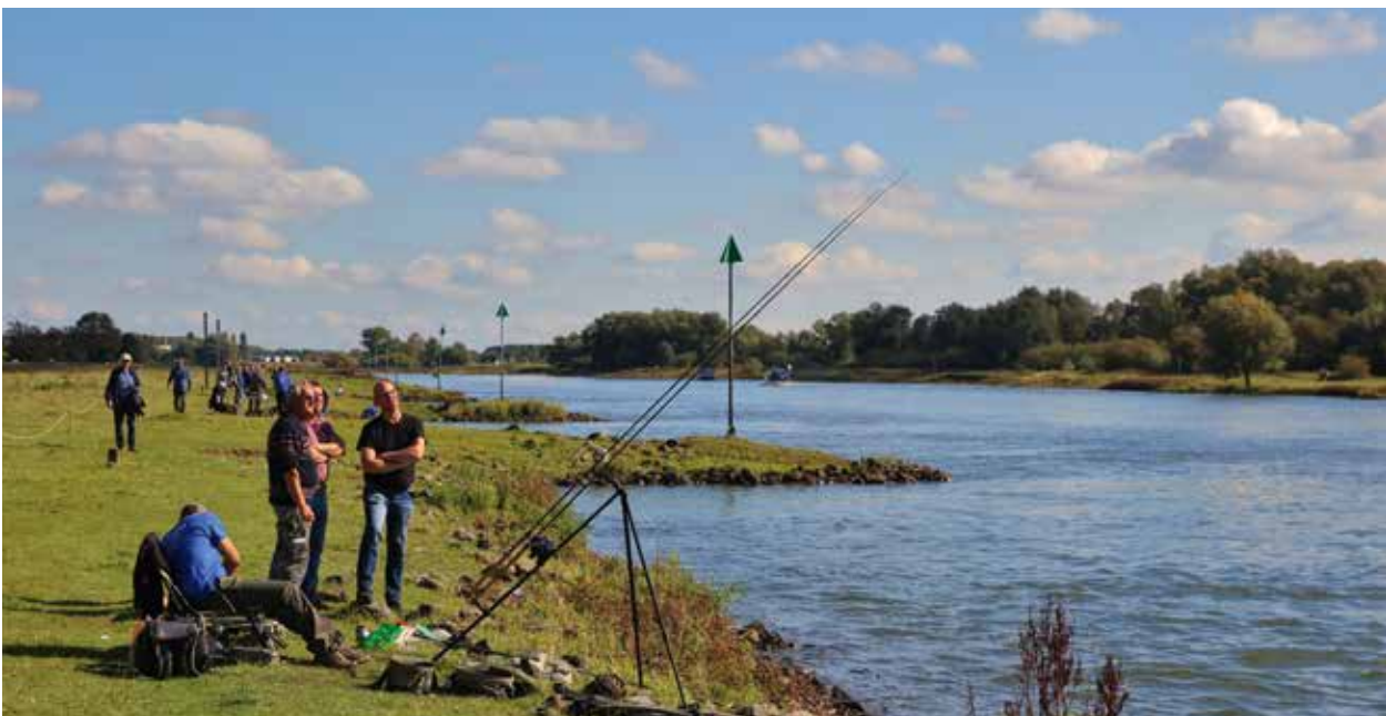
Barbeeldag - demovissers langs de ijsseloever

Sportvisserij Oost-Nederland doet er veel aan om haar achterban te informeren over de werkzaamheden die uitgevoerd worden in het belang van de sportvissers. Via onze website, sociale mediakanalen, onze digitale nieuwsbrief en uiteraard Hét VISblad brengen we actueel nieuws naar buiten. Daarnaast promoten we de hengelsport in het algemeen en de VISpas via beurzen, evenementen en campagnes. Nieuw was het afgelopen jaar de cursus Vakbekwaam Visgids, waarmee we 8 visgidsen hebben opgeleid, die op hun eigen manier een hengelsportspecialisme zullen gaan promoten. Ook ondersteunen we nieuwe initiatieven, zoals bijvoorbeeld een grote roofviswedstrijd die het afgelopen jaar door Duitse sportvissers in ons gebied werd georganiseerd.