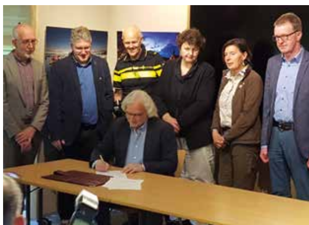
Ondertekening Waterplan Kop van Overijssel

Met het ondertekenen van het Waterplan 2017-2021 op woensdag 10 mei is Sportvisserij Oost-Nederland toegetreden tot het inmiddels 25 jaar bestaande Waterplan kop van Overijssel. Samen met de provincie Overijssel, gemeenten Steen-