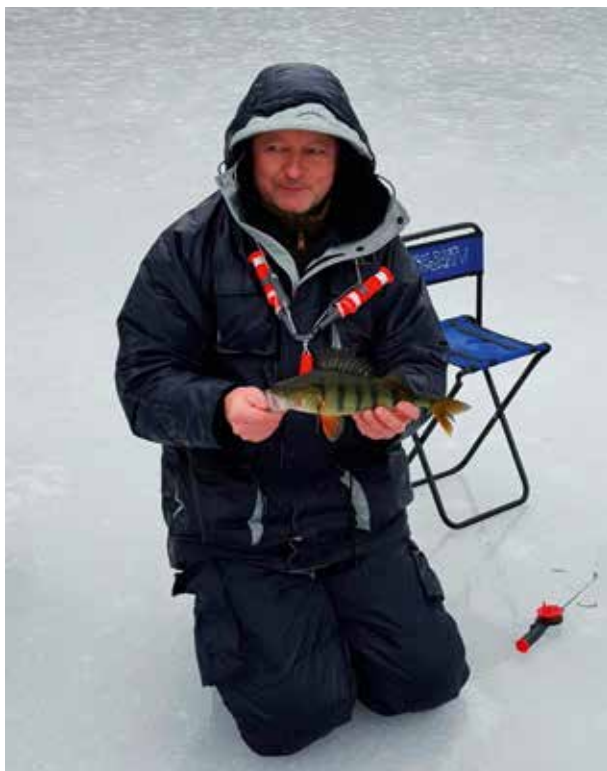
De grootste baars van wedstrijd dag 1