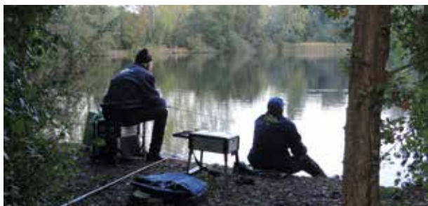
De forellen zijn niet gemakkelijk te vangen

Bij de federatiestand aan het begin van de visplas was het de hele dag een gezellige boel, waarbij velen verrast waren door de mooie locatie. Bezoekers en deelnemers kwamen regelmatig even wat drinken, een praatje maken of kijken hoe het ambachtelijke rookproces in zijn werk ging.