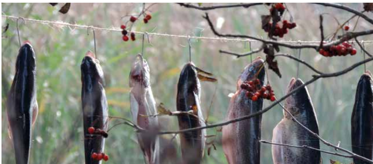
Forellen roken bij de Bijkersplas

Jaarlijks ontvangen onze vrijwilligers rond kerst een VVV-geschenkbon als blijk van waardering voor het vele werk wat zij voor de sportvisserij doen. Om ook "het thuisfront" te bedanken voor de tijd dat hun partner of gezinsgenoot druk is met vrijwilligerswerk voor Sportvisserij Oost-Nederland, hebben we onze vrijwilligers dit jaar een dinerbon ter waarde van € 40,= geschonken, zodat zij een beetje qualitytime met de thuisblijvers terugkregen.