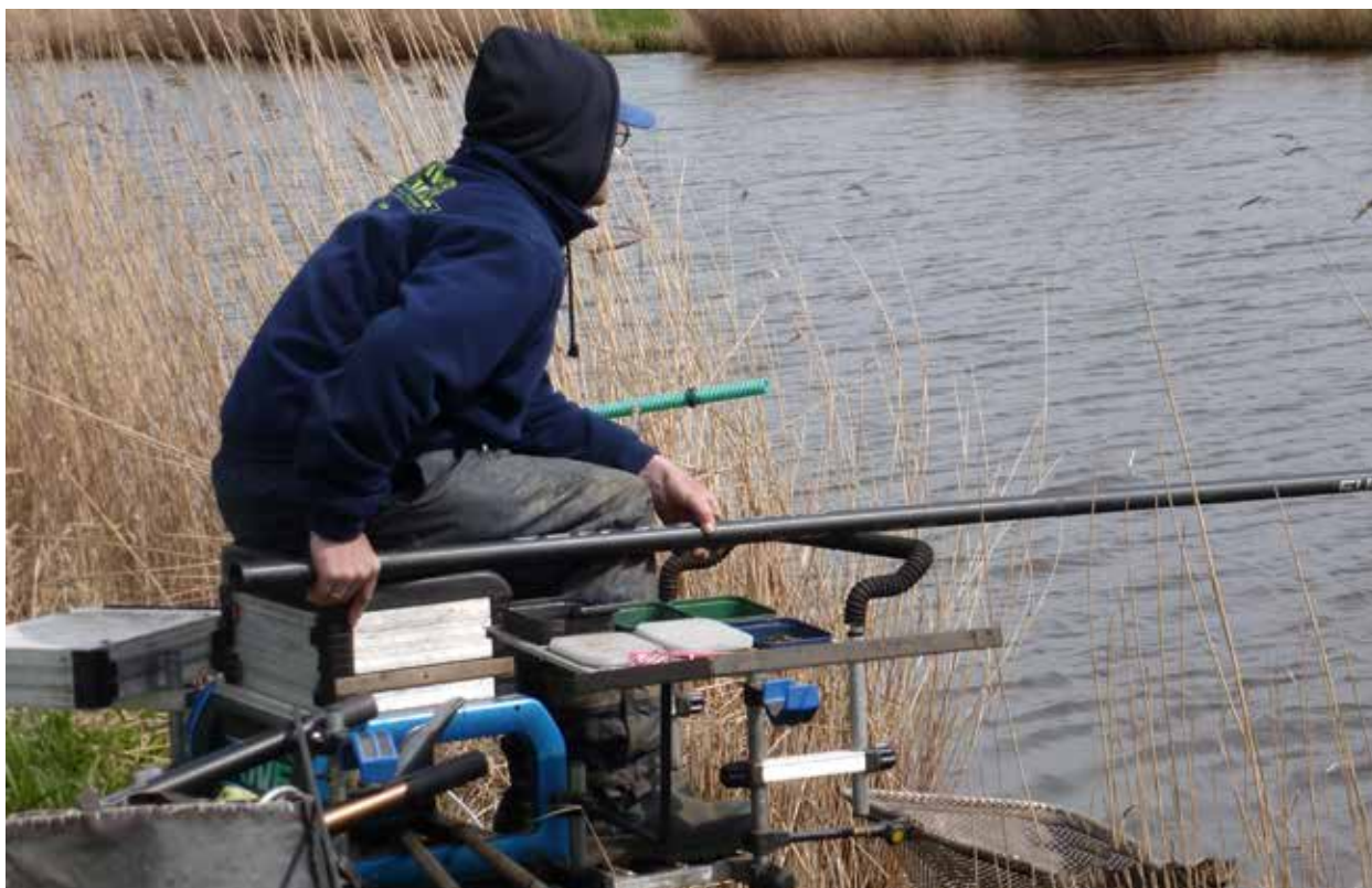
Opperste concentratie tijdens het Noordoostelijk Kampioenschap