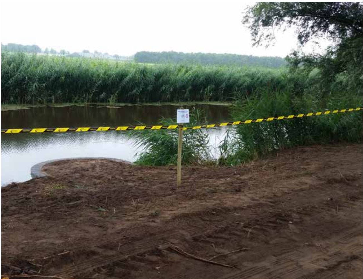
Veilig vissen in het Overijssels Kanaal

Sinds 1 januari 2016 is de Brandemaatvijver opgenomen in de Gezamenlijke Lijst van Nederlandse viswateren. Ondanks dat er nog geen inrichtingsplan lag, begonnen enkele vissers al met het creëren van visplaatsen. In goed overleg met het waterschap Vechtstromen en de omwonenden is uiteindelijk bepaald hoe de vijver het beste ingericht kon worden. Vanaf augustus is er met een vrijwilliger van HSV V.I.O.S. uit En-