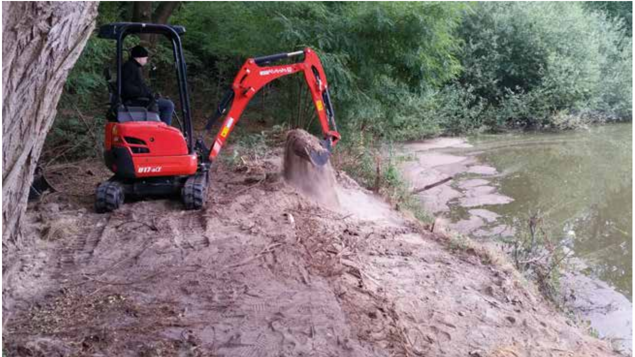
Visstekken maken bij de Brandemaatvijver in Enschede