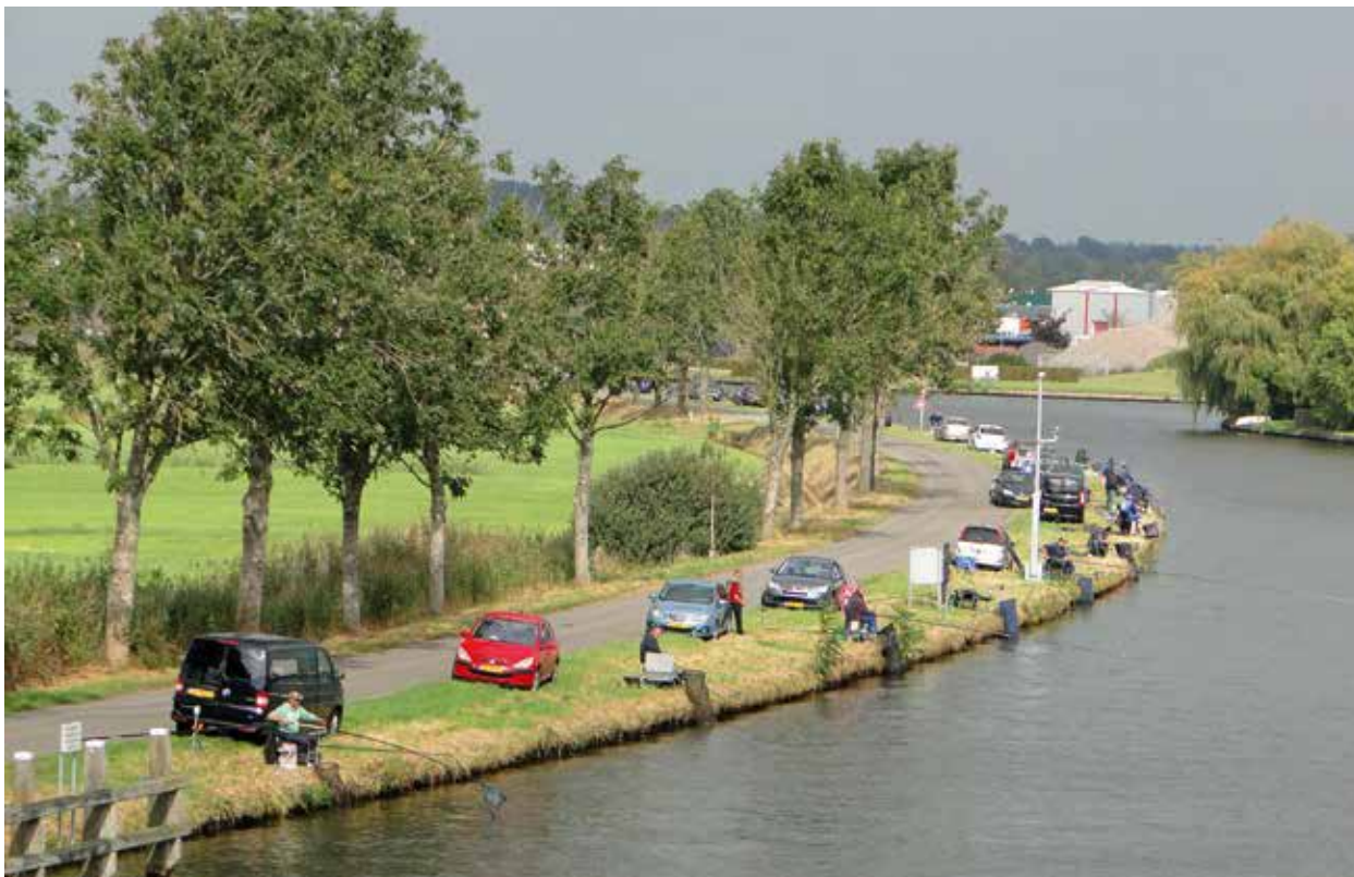
Zonovergoten parcours tijdens de prijzenwedstrijd