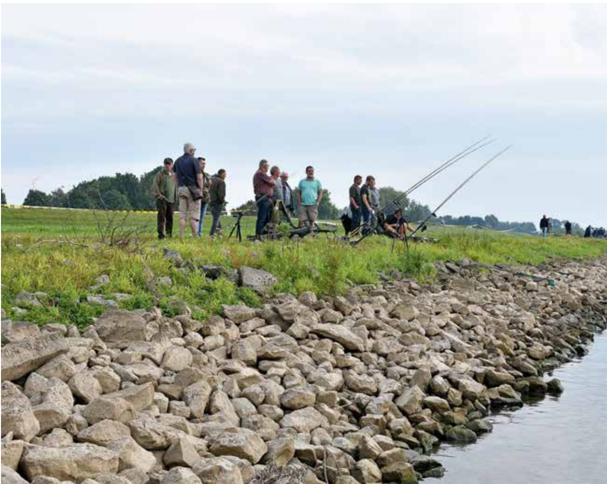
Demonstraties van barbeelspecialisten langs de IJsseloever tijdens de barbeeldag

Enkele verenigingen hebben al gebruik gemaakt van de subsidieregeling, die in 2017 een vervolg zal krijgen.