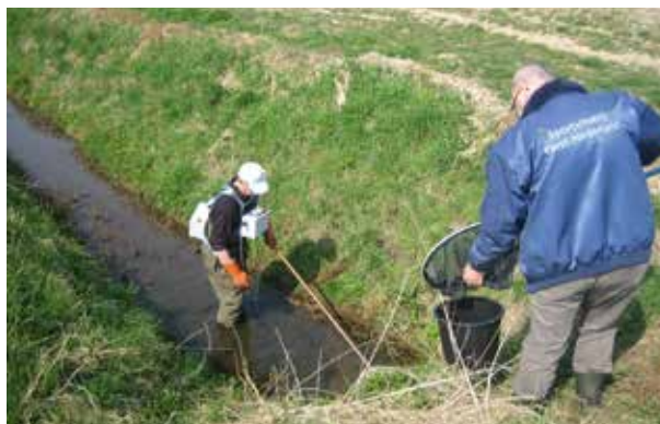
Vissen met het draagbare elektro-apparaat