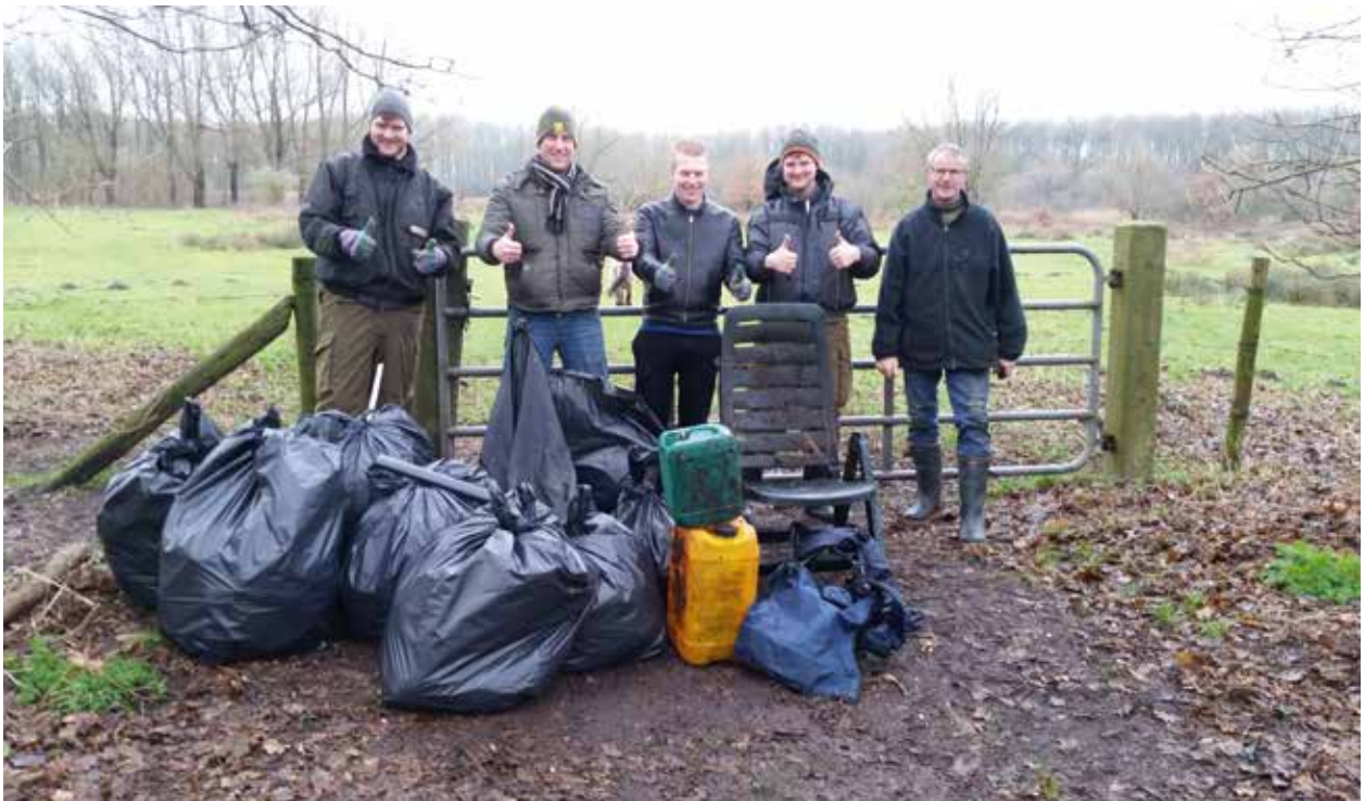
Het resultaat van de opruimactie bij de Stobbeplas bij Hardenberg

Evenals in 2015 hebben we het afgelopen jaar opnieuw meegevoerd aan het project Schone IJssel. Begin maart werden zo'n 15 vuilniszakken vol afval uit de uiterwaarden tussen Fortmond en de kade bij Wijhe op de aanhanger geladen. Ondanks dat veel afval in de uiterwaarden terecht komt door hoog water, zijn we toch actief betrokken bij dit soort acties. Het gaat immers wel om ons "speelveld" en dat willen we graag netjes houden. Naast ROVA is ook Cambio Deventer hierbij betrokken.