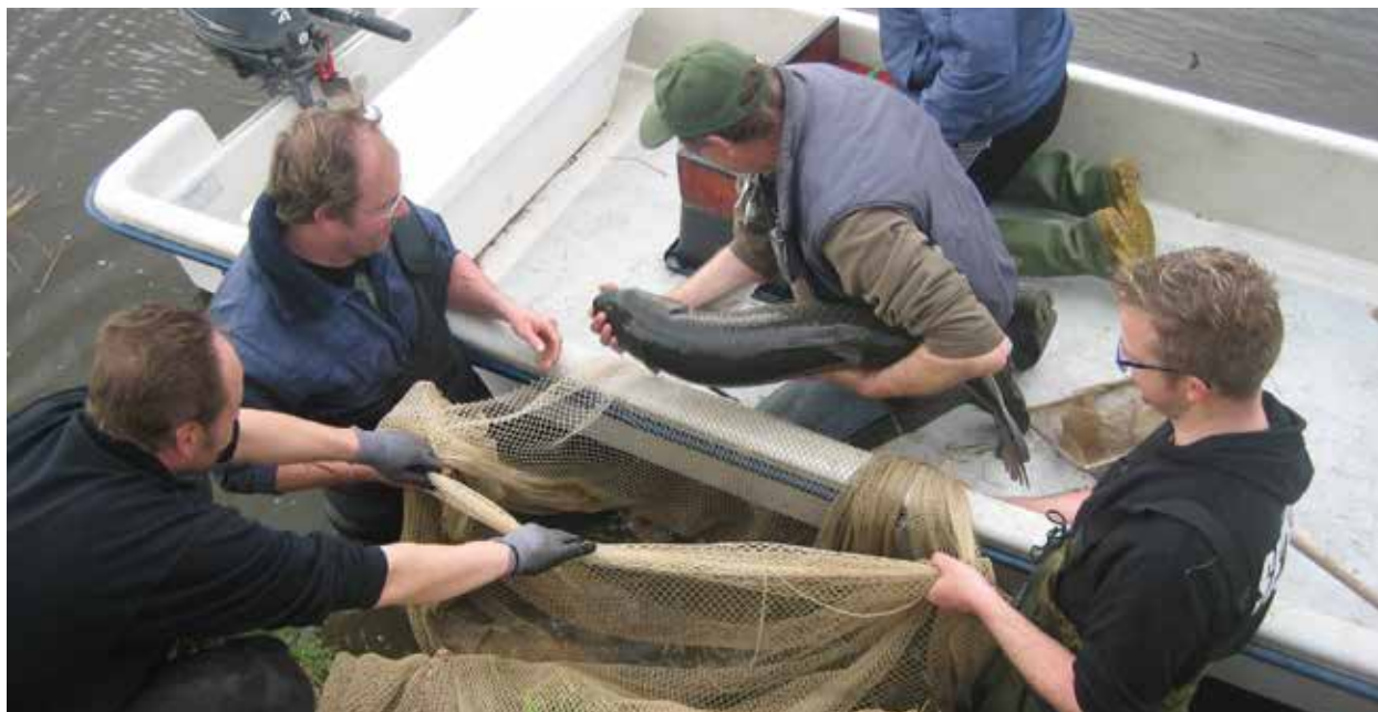
Onderzoek naar de visstand door de Stichting vko