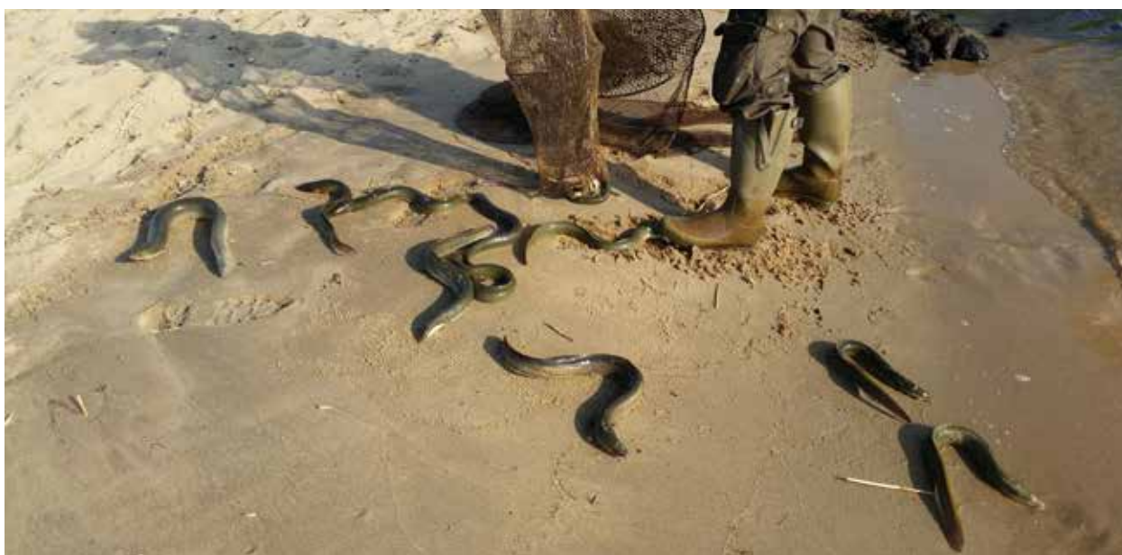
Palingstroperij ontdekt, deze 30 palingen krijgen hun vrijheid terug

In totaal hebben zij 750 vissers gecontroleerd op de juiste vergunningen; maar liefst 3x zoveel vissers als in 2015!