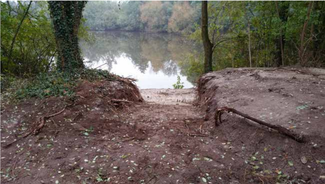
Visstek bij de Brandemaatvijver

schede hard gewerkt om de toegankelijkheid te verbeteren en voorwerk te verrichten voor het kraanwerk, wat in oktober werd uitgevoerd. Enkele visplaatsen werden verbeterd en er zijn nieuwe visplaatsen en een verharde parkeerplaats bij gemaakt. Een aantal visplaatsen ligt redelijk hoog boven de waterspiegel, dit is gedaan met de wetenschap dat het water flink kan stijgen. Op deze manier zullen er altijd een paar stekken bij zijn die het jaar rond te bevissen zijn.