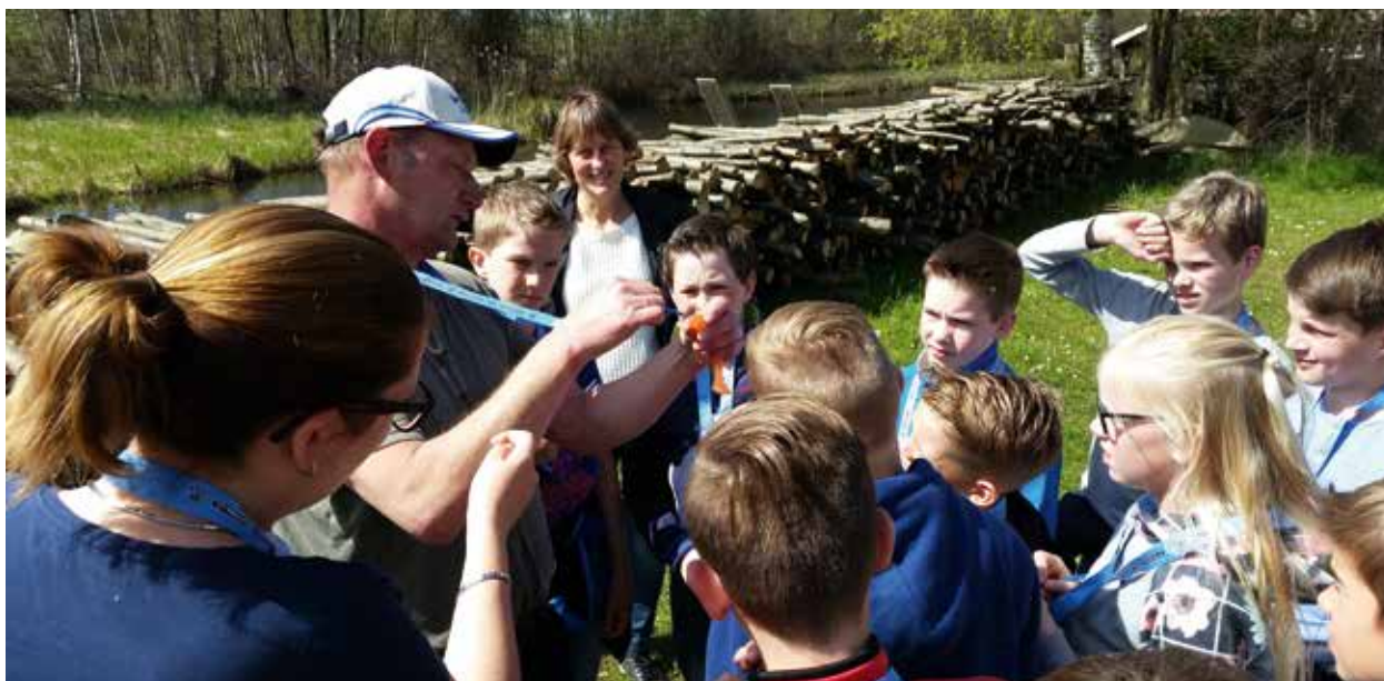
Kinderen van Jeugd Natuurclub de Wieden krijgen instructie vis onthaken