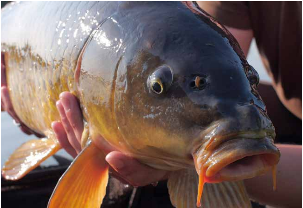
De komende jaren worden karpers uitezet in het gebied van Waterschap Vechtstromen

De commissie WAVI is in 2016 niet bijeen geweest i.v.m. raad over een andere opzet van de commissie WAVI.