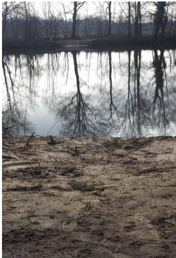
Visstekken bij de Kloot

Ofwel de bergingsvijver ten zuiden van Oldenzaal. Deze vijver bevindt zich naast een klootschietbaan. Regelmatig was er overlast omdat vissers over de baan liepen om bij hun visstek te komen of zelfs hun tent en complete uitrusting midden op de baan plaatsten, terwijl vissen in de vijver officieel niet was toegestaan. De situatie dreigde uit de hand te lopen, dus we grepen in. Eerst hebben we in goed overleg met het waterschap en de klootschietbaan het visrecht vastgelegd. Daarna is de overzijde van de vijver toegankelijk gemaakt voor vissers. Voor alle partijen is er nu ruimte en de rust is wedergekeerd.