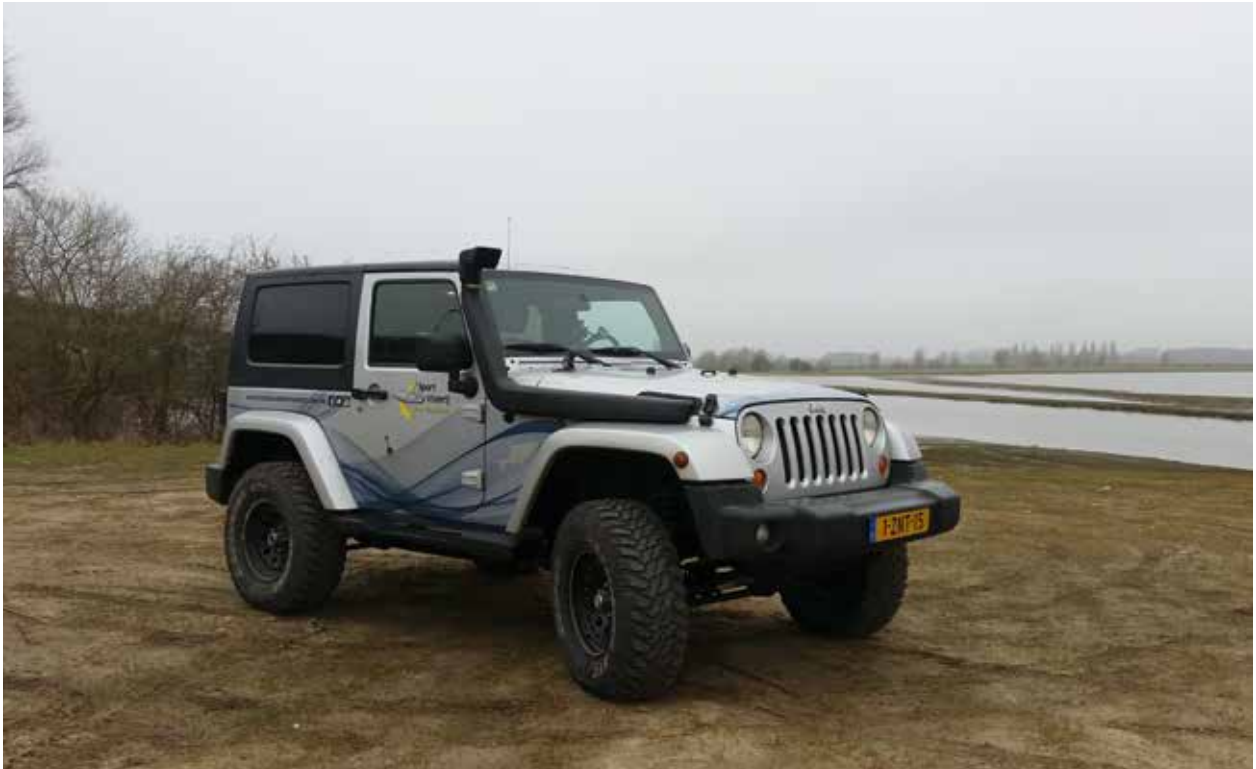
De Jeep wordt o.a. ingezet tijdens controles