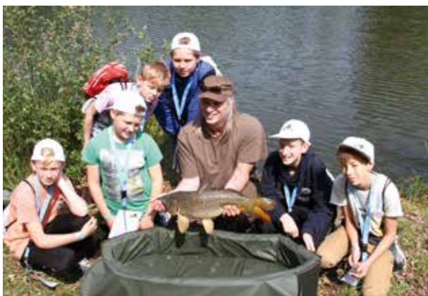
Karper op de kant tijdens de jeugddag

maken heeft! Dat waren de ingrediënten voor een geslaagde jeugddag. Naast verschillende thema's, zoals o.a. roofvissen, karpervissen en vliegvisserij konden de kinderen natuurlijk ook een hengeltje uitgooien. Een leger aan enthousiaste vismeesters stond paraat om de kinderen goed uit te leggen hoe ze moesten vissen én vangen natuurlijk. Als kers op de taart werd deze jeugddag gesponsord met prachtige prijzen door Big Bicycles uit Deventer, Hengelsportcentrum de Beste Stek uit Ommen en Stichting Sportvisserij Promotie & Beleving.