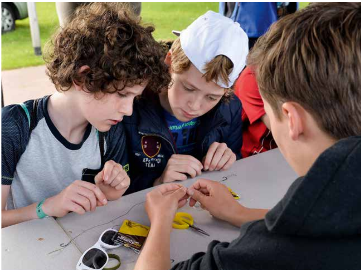
Onderlijnen knopen tijdens de jeugddag