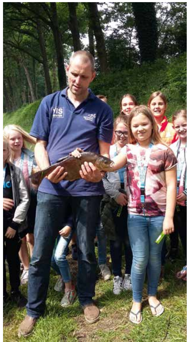
Enorme brasem tijdens visles in Bathmen