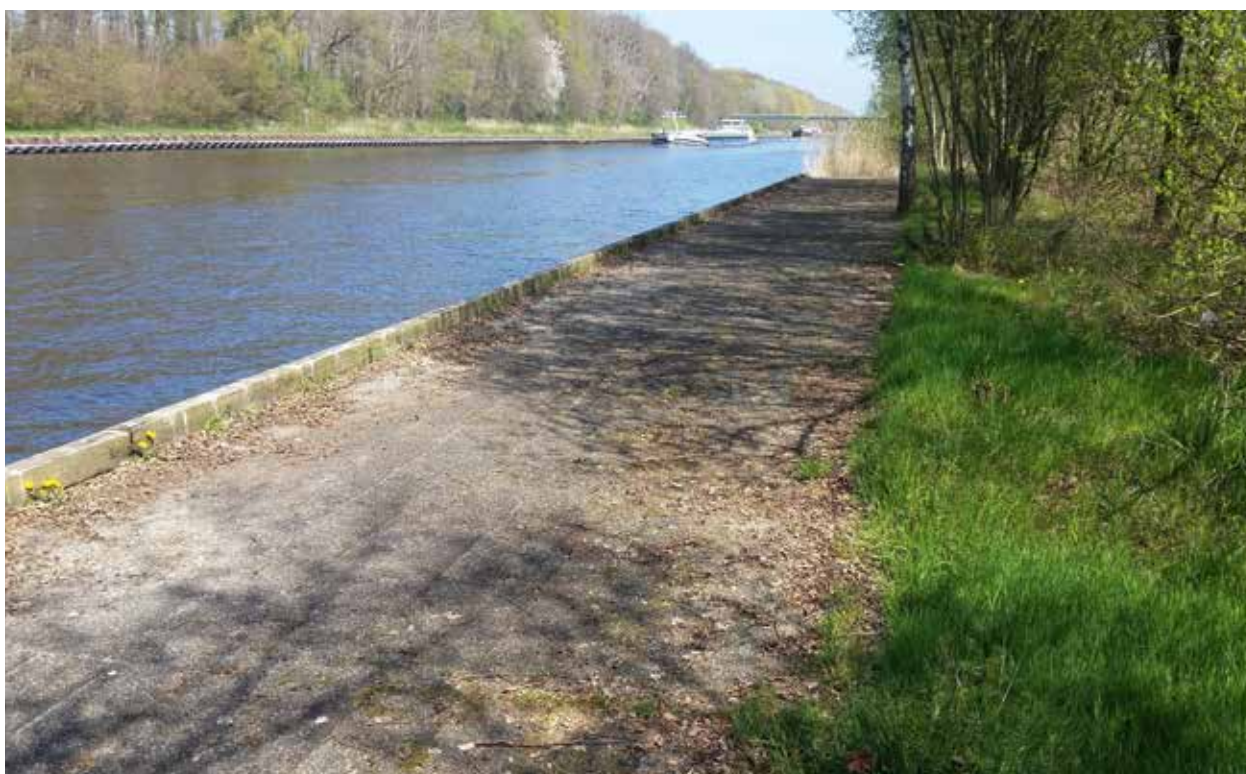
Het Twentekanaal wordt verbreed en uitgediept, vismogelijkheden blijven behouden

In het vorige hoofdstuk heeft u kunnen lezen wat er zoal gebeurt om de visstand op peil te houden en de waterkant toegankelijk te houden voor sportvisser. Het hoofdstuk Sportvisserijvoorzieningen heeft logischerwijs een grote overlap met het hoofdstuk Vis en Water, maar gaat verder in op specifieke maatregelen om de sportvismogelijkheden te behouden, verbeteren of uit te breiden. U moet hierbij denken aan visvlonders of herinrichtingen van viswateren, maar ook aan het indienen van zienswijzen bij ingrijpende projecten waarbij wij de belangen van de sportvisser aan de waterkant behartigen.