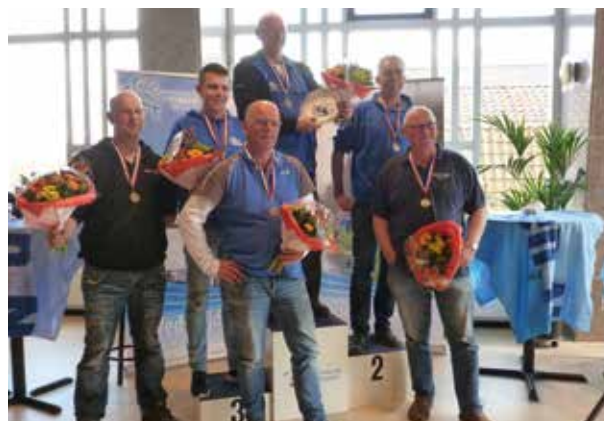
Winnaars Noordoostelijk Kampioenschap

De tweede en derde trede van het erepodium waren voor vader en zoon van Berkel van HSV de Karper uit Brummen met respectievelijk 6.436 en 5.733 gram vis. Hiermee haalden de heren het figuurlijke zilver en brons binnen.