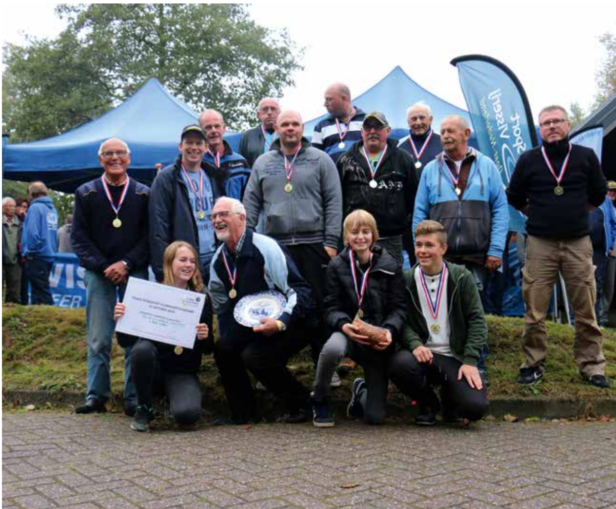
Het Vette Baarsje federatief kampioen