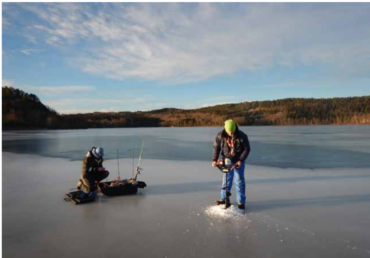
De visgids boort wakken voor de deelnemers aan het NK IJsvissen