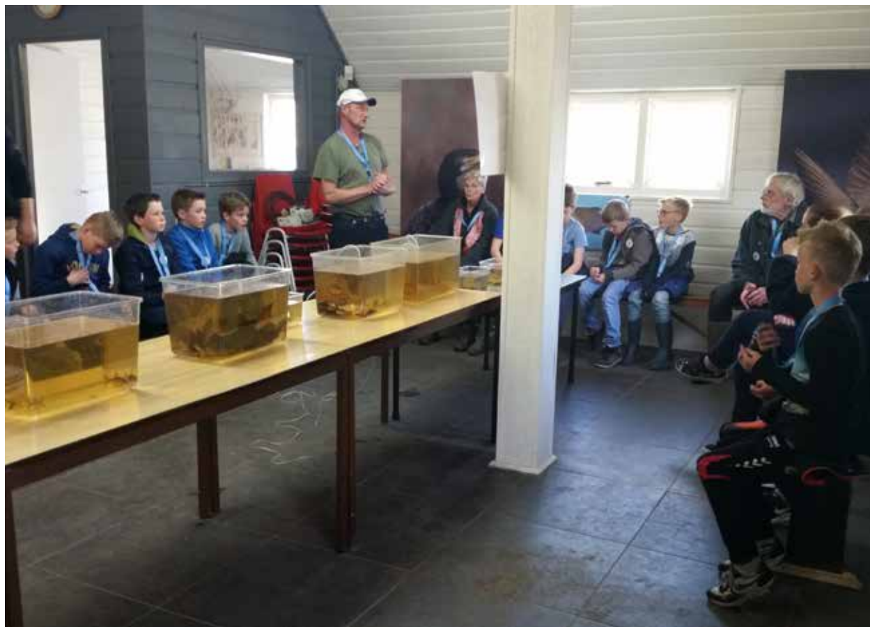
Verskillende vissoorten in de aquaria bij JNC de Wieden

Op woensdag 6 april werd de eerste vismiddag georganiseerd voor 26 kinderen van 7 tot 10 jaar van Natuur Club De Wieden. De activiteit vond plaats bij de werkschuur van Natuurmonumenten aan de Reeënweg te Wanneperveen, waarbij eerst de theorie aan bod kwam en later een hengeltje werd uitgegoid.