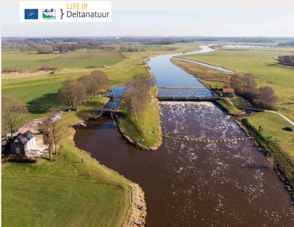
In de Overijsselse Vecht voert Sportvisserij Oost-Nederland samen met Sportvisserij Nederland onderzoek uit naar de migratiepatronen van verschillende soorten trekvis.