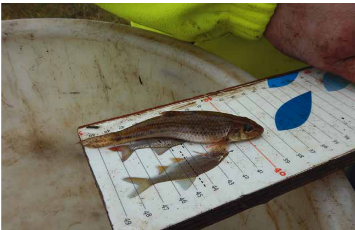
Stichting visserijkundig onderzoek - Riviergrondel