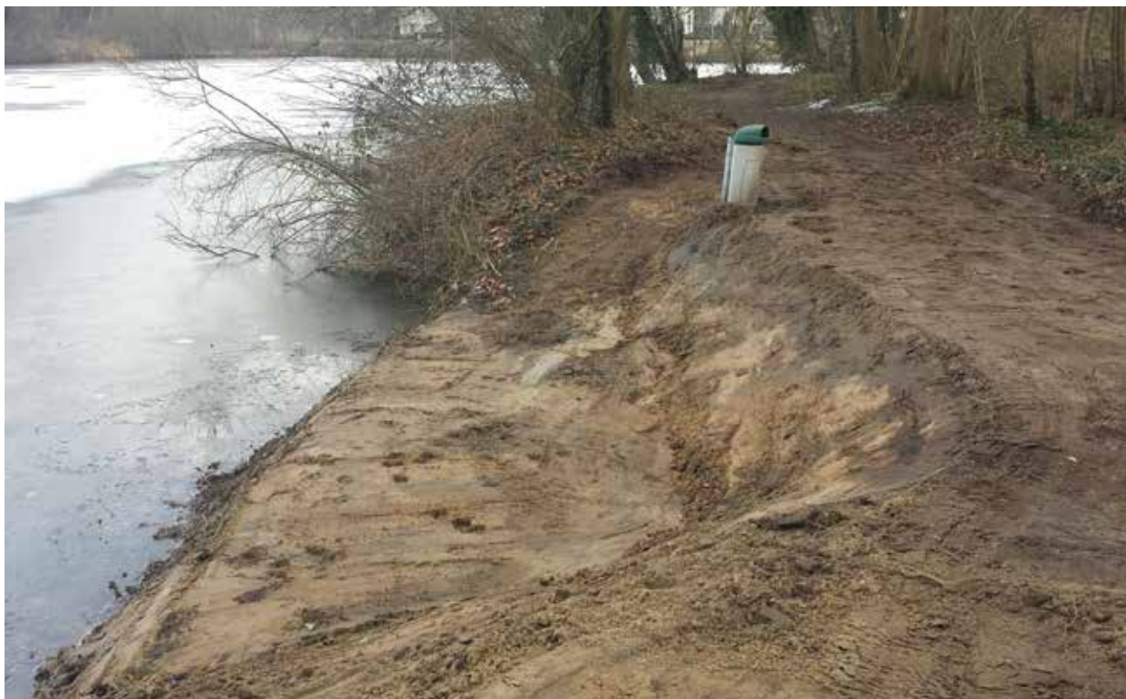
Stekken maken bij de Kloot

Sportvisserij Oost Nederland heeft vrijwilligers van alle verenigingen de mogelijkheid geboden om gratis een bosmaaier- en motorkettingzaag cursus te volgen. Dit is gedaan zodat iedere vrijwilliger veilig, getraind en gecertificeerd maai- en zaagwerk kan uitvoeren. Na bekendmaking van het aantal cursusdagen en de exacte cursusdata hebben 18 cursisten de cursus gevolgd bij Helicon opleidingen in Apeldoorn. Alle 18 cursisten, afkomstig van 10 verschillende verenigingen, hebben de cursus met succes afgerond en zijn reeds in het bezit van de certificaten.