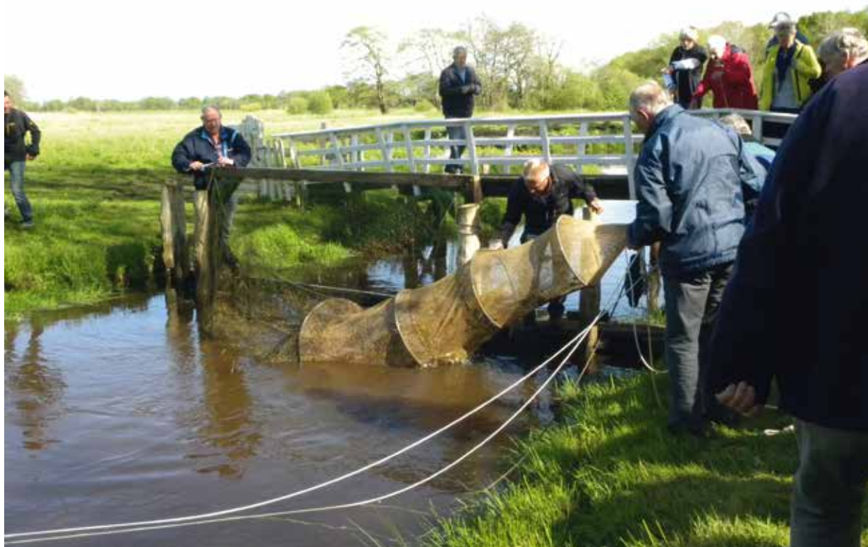
Aalstal in de Reest bij IJhorst

De Bond van Binnenvissers is in overleg met Natuurmonumenten over een aalbeheerplan. Een definitief plan zal naar verwachting in 2016 klaar zijn.