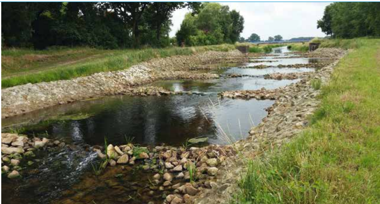
Vistrap Schipbeek Buurserbeek