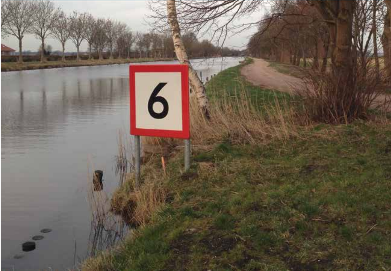
Wanneer worden de visvlonders aan het Steenwijkerdiep gerealiseerd