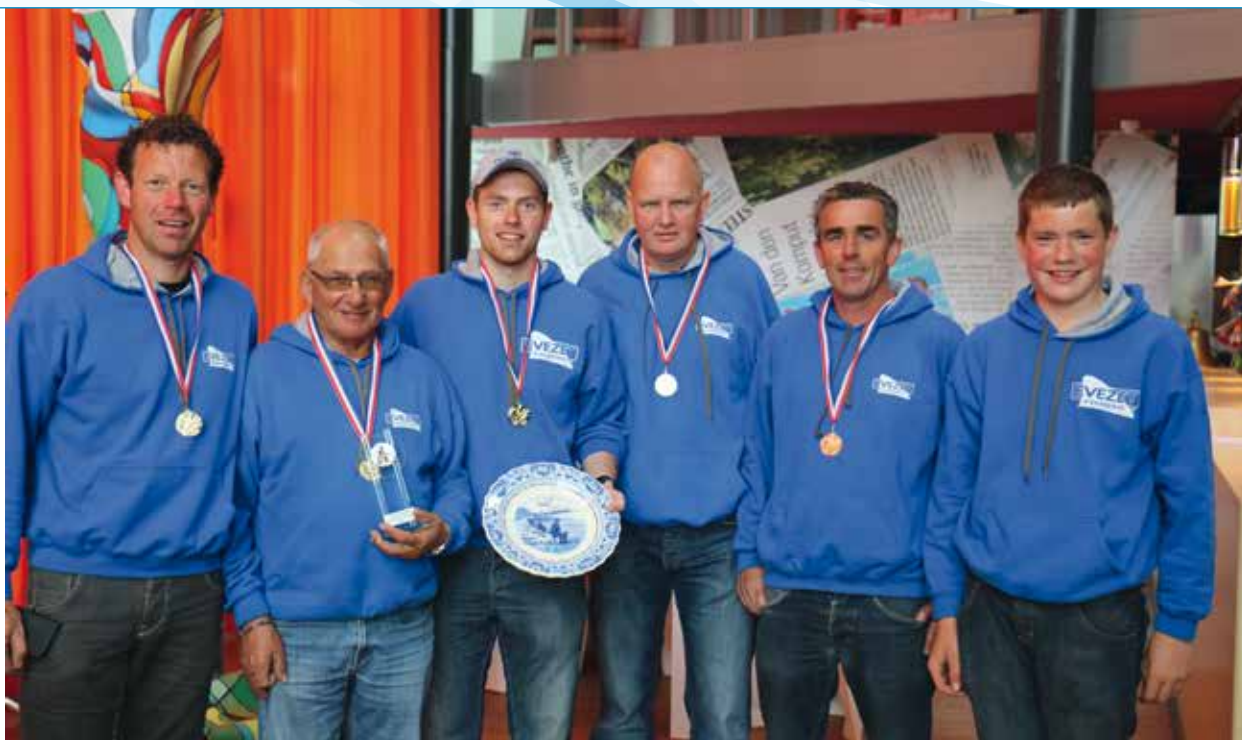
Winnend korps HSV De Karper II

In het hoofdstuk Wedstrijden vindt u een overzicht van de wedstrijden die het afgelopen jaar georganiseerd werden door Sportvisserij Oost Nederland, eventueel in samenwerking met andere federaties en Sportvisserij Nederland. Voor wat betreft de uitslagen van de selectiewedstrijden beperken we ons tot degenen die doorgaan naar het NK. Dit kunnen zowel wedstrijdvisseren zijn die deel uitmaken van de Nationale Selecties als die zich geplaatst hebben via de selectiewedstrijden.