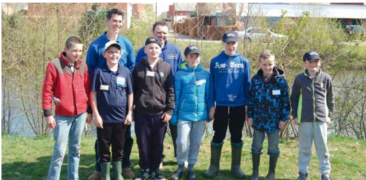
7 talenten deden mee aan de jeugclinic