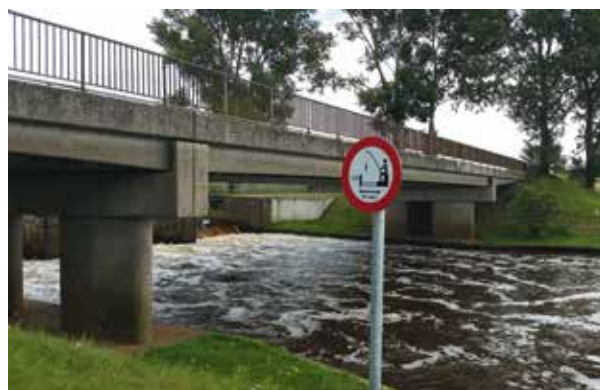
Bebording bij stuw

De Vecht is één van de grotere en belangrijkere wateren in Oost Nederland. Het is dan ook niet gek dat deze parel jaarlijks een groot aantal sportvisserij aantrekt. Dit zijn ook vissers uit het buitenland zoals Engeland en Duitsland. Voor de Vecht geldt een bijzondere regel die is vastgelegd in de visserijwet. "Het is verboden te vissen binnen een afstand van 75 meter stroomafwaarts van een stuw, in een bij een stuw aangebrachte vispassage of binnen een straal van 25 meter voor de bovenmond van deze vispassage" . Deze tekst is vrijwel bij elke stuw in de Vecht te vinden, echter weten de buitenlandse vissers door de taalbarrière niet wat er precies bedoeld wordt, wat vervolgens leidt tot bekeuringen. Er is daarom besloten om non-verbale bebording aan te brengen bij de stuwen zodat het ook voor deze groep vissers duidelijk is wat de regels zijn.