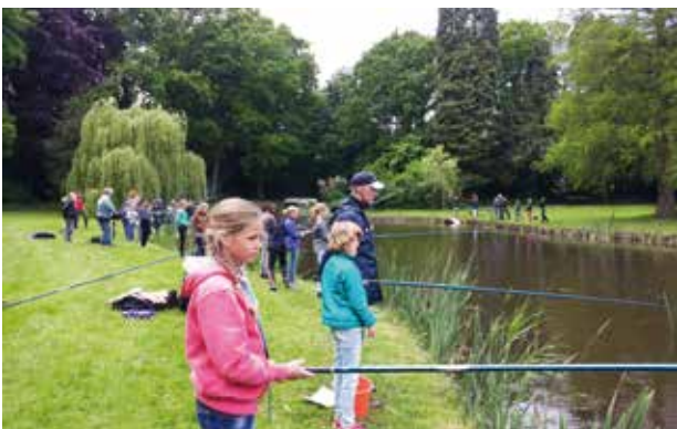
Visles op de basisschool

Het afgelopen jaar zijn maar liefst 92 vislessen verzorgd op basisscholen in Oost Nederland. Een poule van 12 actieve en enthousiaste vismeesters heeft hiermee 1870 kinderen weten te bereiken en velen daarvan op een positieve manier kennis laten maken met de hengelsport. Inmiddels zijn er verschillende scholen die de vislessen geïntegreerd hebben in hun lesplan en al enkele jaren opnieuw een visles aanvragen. Niet alleen voor de kinderen is een visles een hele belevenis, maar ook onze vismeesters halen hier veel voldoening uit. Wat is er nou mooier om een blij gezicht te zien, wanneer een kind zijn of haar eerste vis vangt. Ook krijgen we erg positieve reacties van docenten. Opvallend zijn de zeer positieve reacties uit het speciaal onderwijs, waarbij kinderen tijdens het vissen opeens veel meer concentratievermogen blijken te hebben dan bij de reguliere lessen op school.