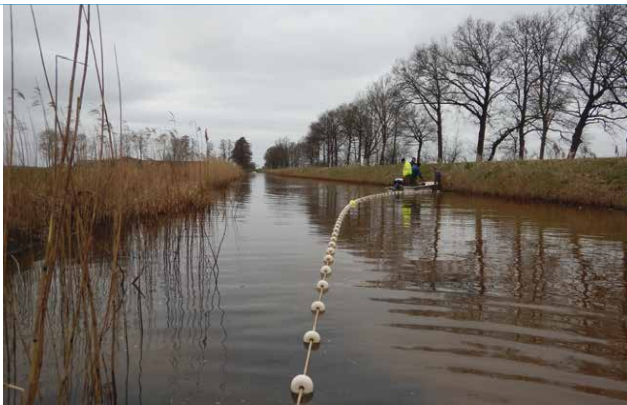
Stichting Visserijkundig Onderzoek