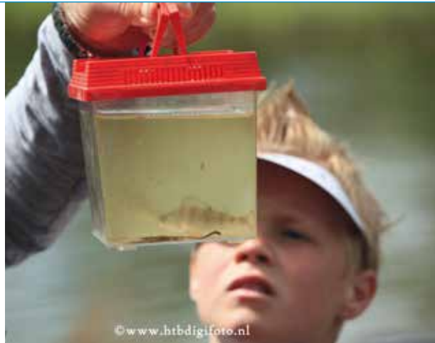
Visherkenning komt aan bod bij verschillende activiteiten

Het werd een bijzonder mooie dag met veel belangstelling van de jeugd. Deze keer hadden we de activiteiten uitgebreid