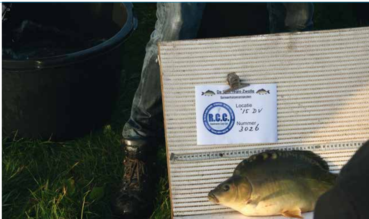
In de WAVI wordt o.a. de uitzet van spiegelkarpers door de KSN besproken