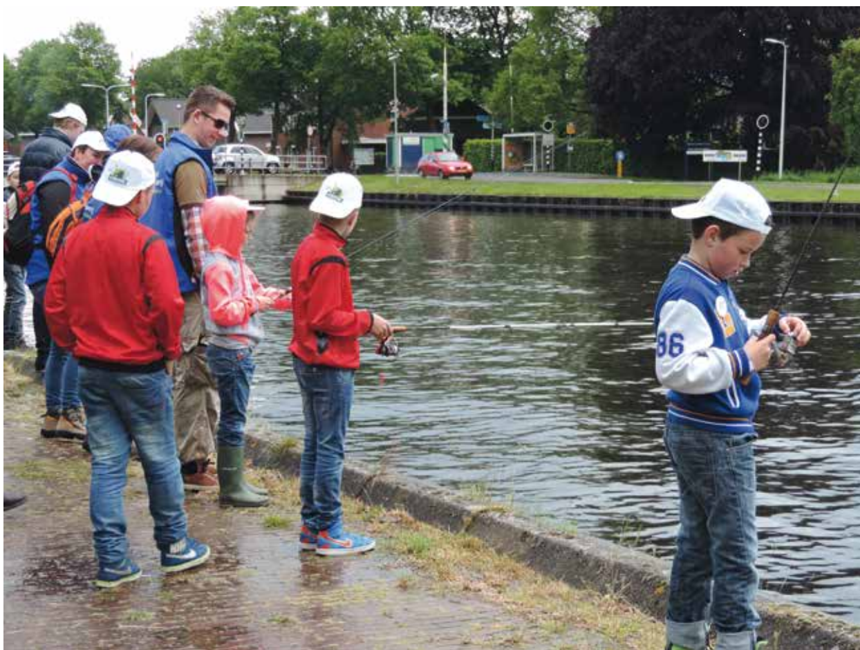
Jeugddag Nationale Hengeldag

Dat controle ook een spannend onderdeel kan zijn, bleek wel bij de stand die ingericht was met verboden voorwerpen die zijn aangetroffen tijdens controle. Tijdens de jeugddag wist de boa