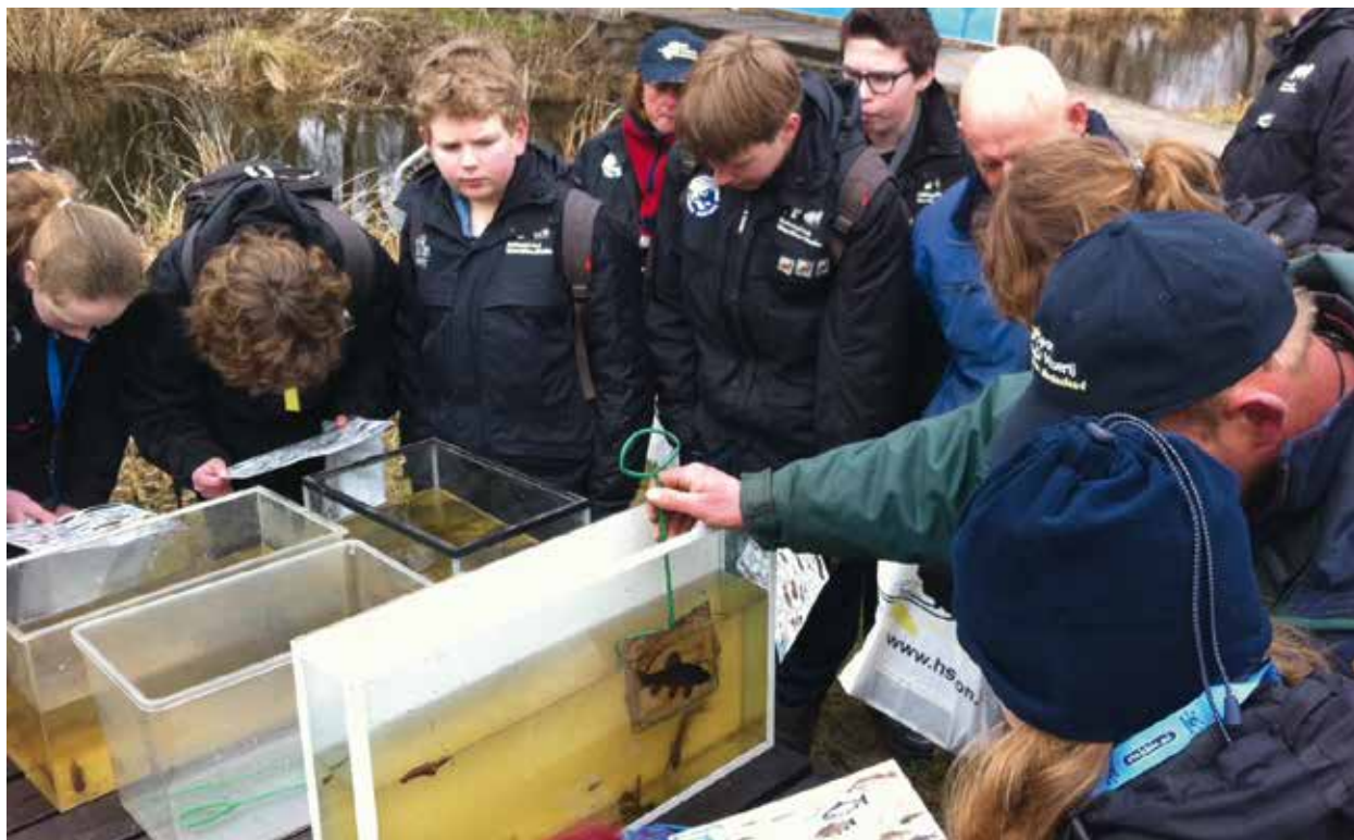
Junior Rangers determineren vissen

Op zaterdag 25 mei jl. was het Nationale Hengeldag en vond onze jaarlijkse jeugddag weer plaats rondom de Drostenkampvijvers te Raalte. Met zo'n 100 kids en 60 vrijwilligers kunnen we spreken van een fantastische opkomst! 's Ochtends hadden