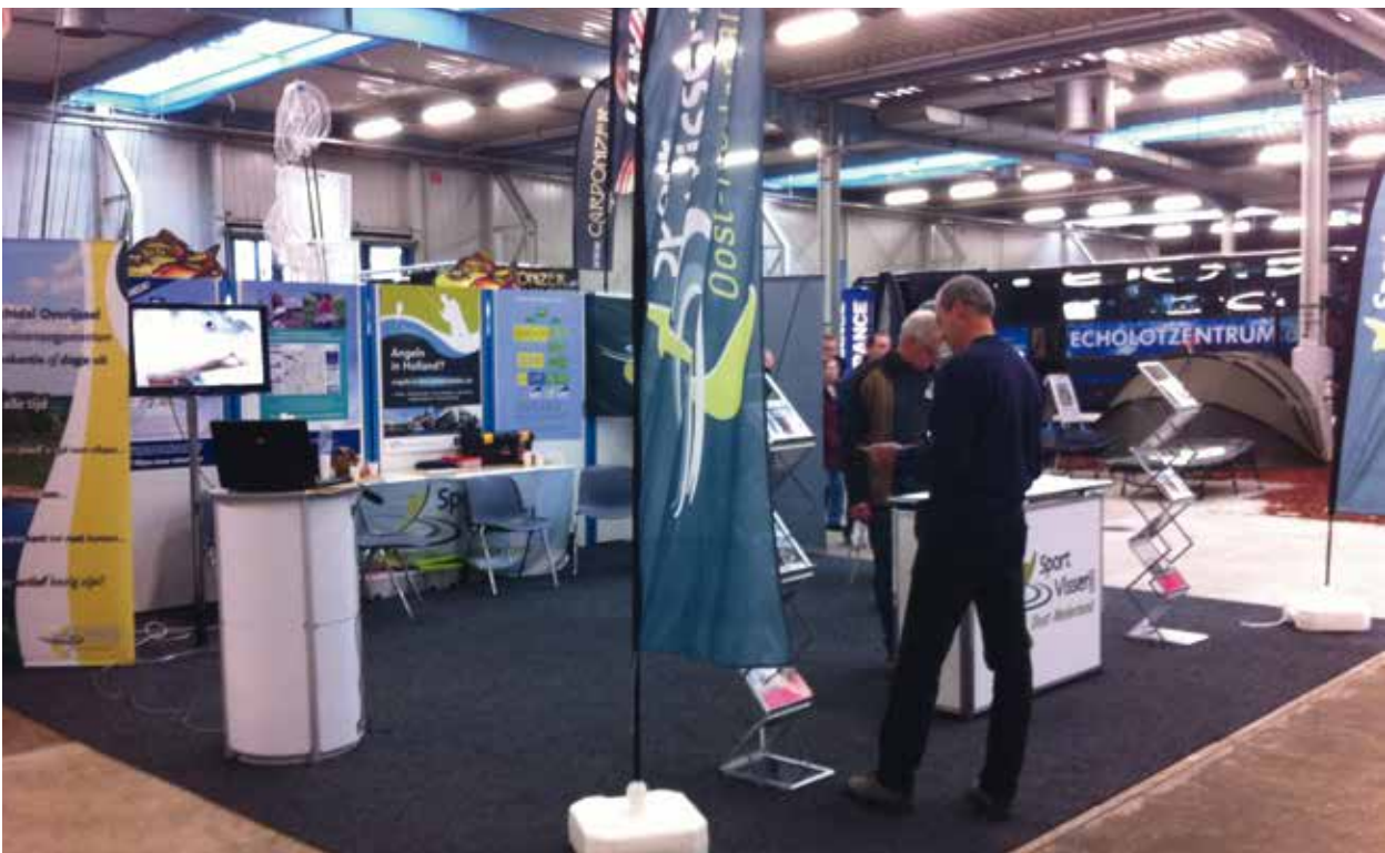
Faszination Angeln Lingen

De tijd staat niet stil en ook Sportvisserij Oost Nederland draait op volle toeren mee met de moderne technieken. Om meer contact te krijgen met onze achterban hebben onze medewerkers een training social media gevolgd. Facebook en Twitter zijn het afgelopen jaar al regelmatig ingezet om onze volgers meteen op de hoogte te stellen van leuke en interessante nieuwtjes, vaak meteen vanuit het werkveld. Natuurlijk wordt onze website ook actueel gehouden en hebben we 2 maal per jaar onze regio-editie van Hét VISblad, wat gratis onder al onze aangesloten sportvissers verspreid wordt.