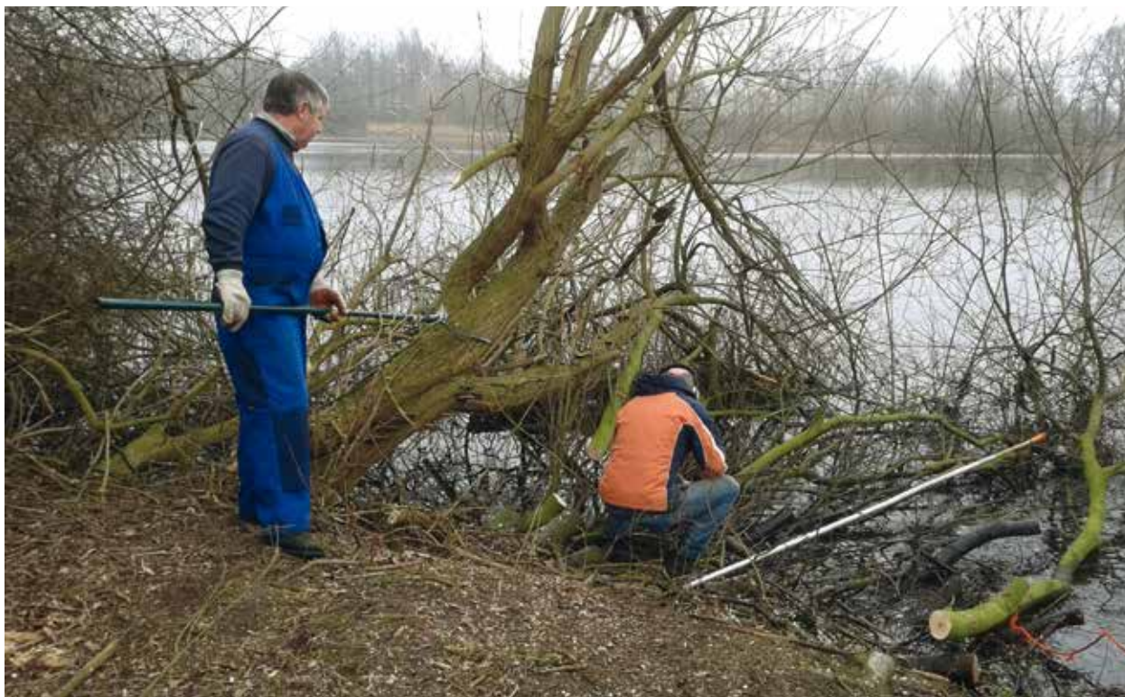
Subsidieregeling maaien en onderhouden van visstekken

De onderhoudsperiode geldt van april t/m oktober van het betreffende jaar.