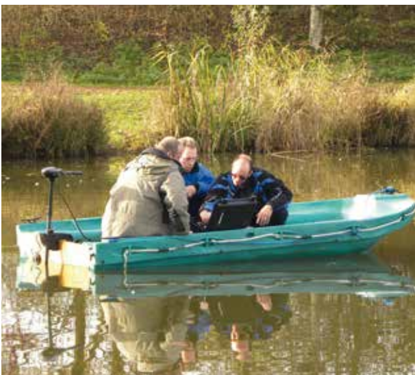
Leren werken met de meetapparatuur

Een water van boven bekijken is snel gedaan. Je ziet de beplanting, de oevers en de stekken die je kunt bevissen. Maar waar vis je nou eigenlijk? Hoe diep is het water precies? Waar bevindt zich dat ene talud waar die vis zich ophoudt? Om antwoord te geven op deze vragen is er een unieke samenwerking ontstaan tussen Sportvisserij Oost Nederland, AOC de Groene Welle en het bedrijf Ribbink Nautic te Hoevelaken.