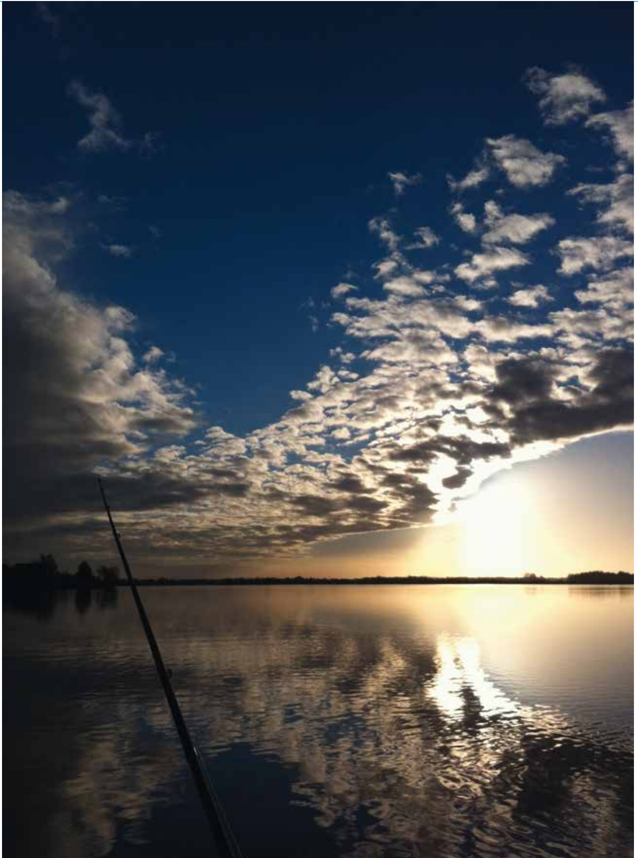
Lekker vissen en genieten....