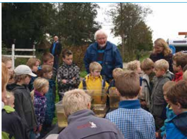
Vismiddag jeugdnatuurclub de Weerribben

we rondom de vijvers verschillende thema's waar de kinderen uitleg kregen en waaraan zij ook actief mee konden doen. Specialismes zoals roofvissen, karpervissen, vliegvisserij, matchvissen, feedervissen en natuurlijk vissen met de vaste stok kwamen uitgebreid aan de orde. Maar ook het maken van het perfecte visvoertje, werptechnieken en drilltechnieken werden in de praktijk gebracht. Onze plaatselijke BOA gaf de kinderen uitleg over de (Jeugd)VISpas en de regels die je in acht moet nemen als je gaat vissen.