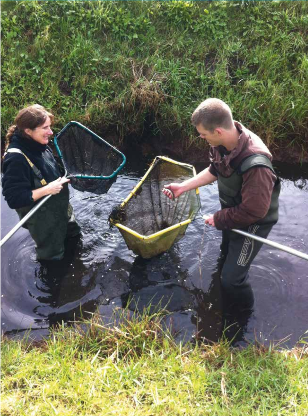
Schepnetvissen tijdens vissenweekend Ravon