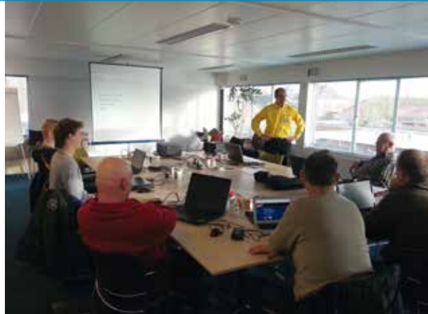
Uitleg over het programma Reefmaster

Van weinig wateren in ons gebied was ook maar iets bekend over de waterbodem. Dit heeft binnen Sportvisserij Oost Nederland geleid tot de aanschaf van meetapparatuur waarmee waterbodems digitaal in kaart kunnen worden gebracht. De gegevens kunnen dan middels speciale software worden omgezet in een waterbodemkaart. In ons geval is gekozen voor het programma Reefmaster. Dit programma is in staat om de met een geavanceerde dieptemeter verzamelde informatie om te zetten in een gedetailleerde kaart van de bodem. Het is zelfs mogelijk om een 3D projectie te maken van de bodem, waardoor diepten en ondiepten nog sprekender worden uitgebeeld.