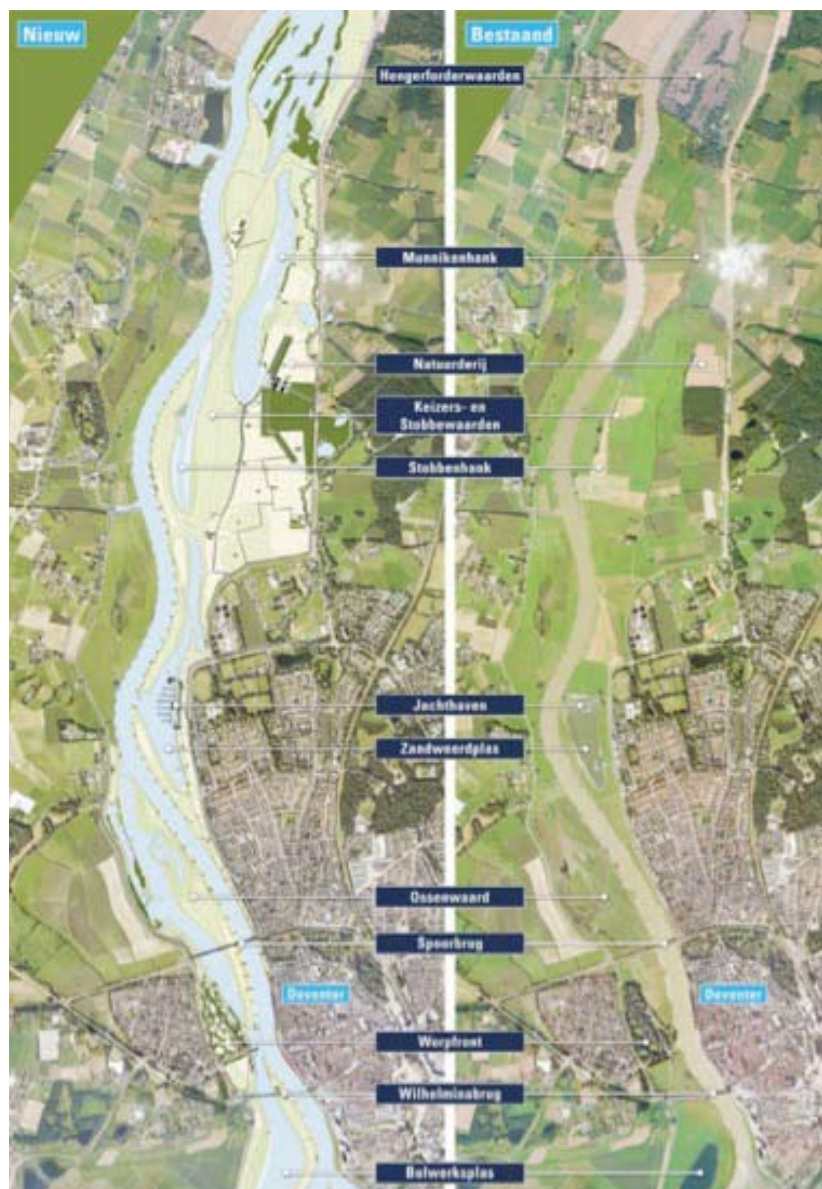
Projectkaart Ruimte voor Rivieren bij Deventer